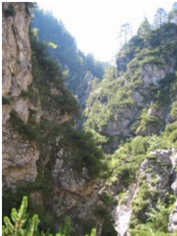
Dolina potoka Mala Pišenica

Sestavljene so iz mezozojskih gorskih vsedlin. To so večinoma apnenci in dolomiti, zato so stene strme vrhovi in grebeni pa špičasti. Med verigami ležijo tudi ledeniške doline(dolina potoka Mala Pišenica).