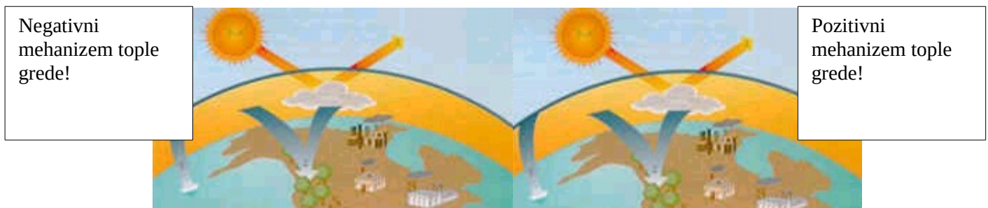
(a) Negativni in (b) pozitivni mehanizem tople grede

Zaradi dolge življenjske dobe plinov v ozračju (CO 2 : 50-200 let, NO x : 150 let, CFC: 65-130 let) bodo ti celo v primeru takojšnjega prenehanja emisij še vedno vplivali na globalno segrevanje. Čim daljše bo obdobje povečanja emisij, tem obsežnejše, časovno bolj zgoščeno in bolj zahtevno bo potrebno zmanjšanje v prihodnosti.