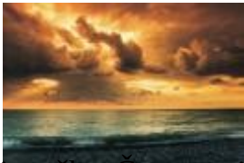
Najnižja točka: Črno morje 0 m

Za površinsko oblikovanost Ukrajine so značilne predvsem rodovitne ravnine, ali stepe in planote prepredene z rekami kot so Dnjeper, Dnjester, Južni Bug in Donec, ki se iztekajo v Črno morje in Azovsko morje. Na jugozahodu delta reke Donave tvori mejo z Romunijo. Edini gorovji v Ukrajini sta Karpati na zahodu in Krimske gore na jugu.