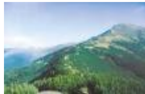
Najvišja točka: Hora Hoverla 2,061 m