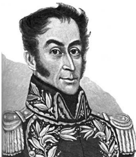
Slika 3 Simon Bolivar

Zaradi vse večjih nasprotij med Bolivarjevimi privrženci in nasprotniki je Venezuela po Bolivarjevi smrti (1830) izstopila iz Velike Kolumbije in razglasila neodvisnost. Njen prvi predsednik je postal Jose Antonio Paez in vzpostavil osebno diktaturo. Že takrat so v Venezueli potekali hudi politično boji med konservativci in liberalci, na oblasti pa so se vse do leta 1958 menjavali različni diktatorji.