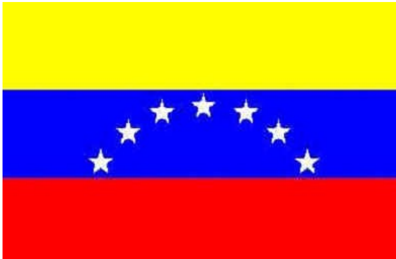
Slika 2 Zastava Venezuele

Vsaka od 22 zveznih držav ima lastno zakonodajalno skupčino in guvernerja.