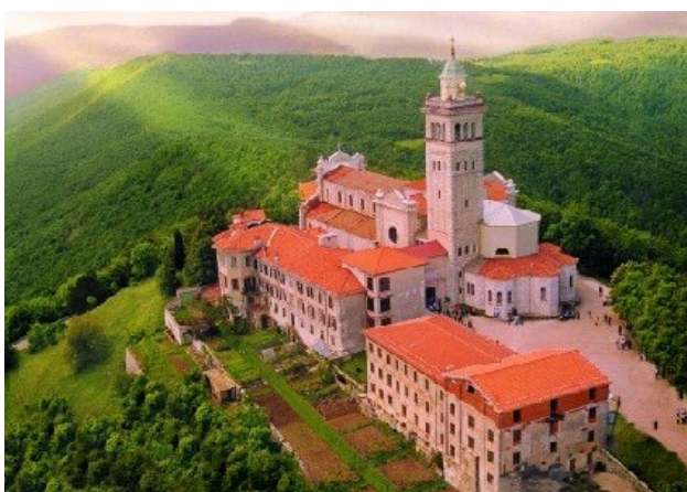
Slika 17: Sveta Gora

V pokrajini je še veliko neizrabljenih turističnih možnosti: stara naselja Vipavski Križ, Goče in Šmarje, Sveta Gora z romarsko baziliko svetogorske Matere Božje in celotna vinogradniška pokrajina.