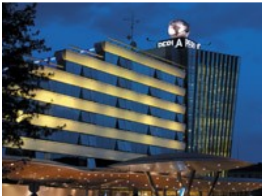
Slika 11: HIT Casino Perla

Turizem je razmeroma nepomembna dejavnost, a v Novi Gorici se je v zadnjih letih razvilo igralništvo (npr. HIT Casino Perla, HIT Casino Park). Igralnice obiskujejo predvsem premožni Italijani.