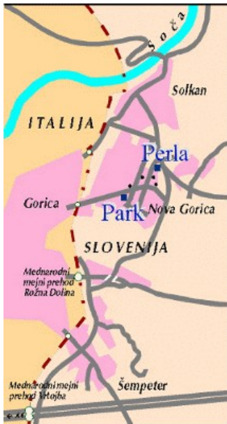
Slika 5: Meja med Slovenijo in Italijo, med Gorico in Novo Gorico

Nova Gorica je posebnost med slovenskimi mesti. Zasnoval jo je arhitekt Edo Ravnikar (1907-1993) s sodelavci. Naselje naj bi bilo zasnovano kot »vrtno mesto« z jasno ločenimi upravnimi, gospodarskimi, stanovanjskimi, poslovnimi in drugimi predeli ter z ločenima pasovoma za promet in pešce. Mesto naj bi imelo nizko gostoto zazidave ter veliko zelenic, parkov in drevja. Ta načrt se je sicer uveljavil le na začetku gradnje ob dveh osrednjih ulicah. V celoti pa Nova Gorica daje vtis odprtega, z zelenjem bogatega mesta, kakor je značilno za severno primorska mesta.