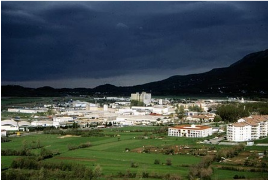
Slika 8: Ajdovščina

Danes so v Ajdovščini pomembne naslednje industrijske panoge: živilska (tovarna sadnih sokov Fructal, Mlinotest), tekstilna (Tekstilna, IKA), kovinska, pohištvena (Lipa, Duka), lesna in gradbena (Primorje, Gradbeno obrtno podjetje) industrija.