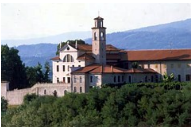
Slika 16: Samostan Kostanjevica

V pokrajini je še veliko neizrabljenih turističnih možnosti: stara naselja Vipavski Križ, Goče in Šmarje, Sveta Gora z romarsko baziliko svetogorske Matere Božje in celotna vinogradniška pokrajina.