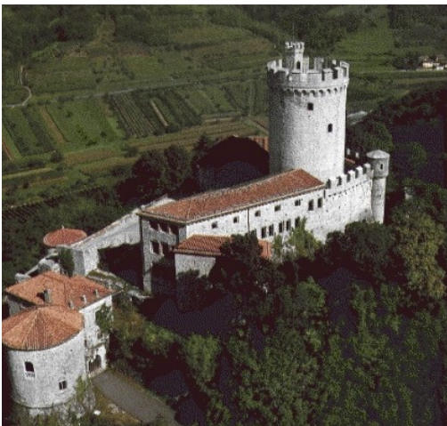
Slika 14: Grad Rihemberk