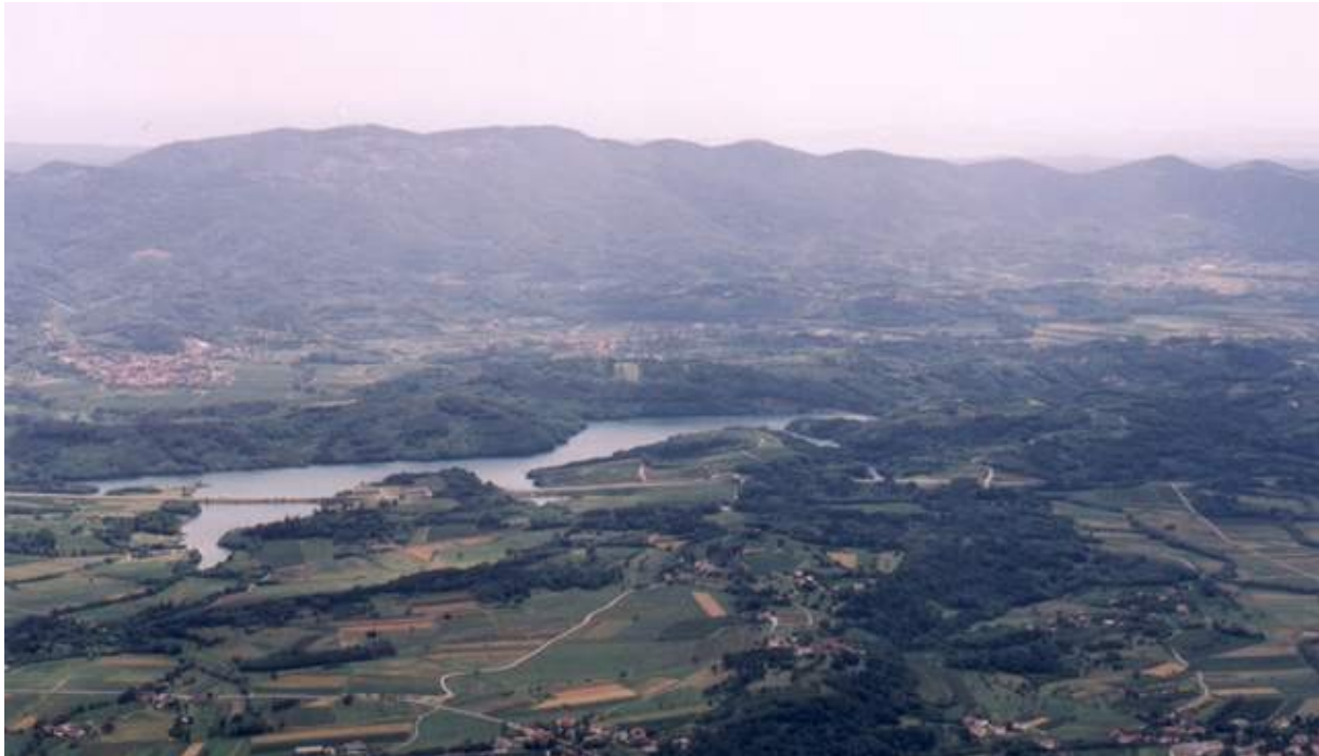
Slika 1: Vipavska dolina

Glavne značilnosti pokrajine so prevlada fliša, submediteransko podnebje, ki omogoča posebne kulture in zgodnje pridelke, in razraščanje terciarnih dejavnosti zaradi prometno prehodne obmejne lege.