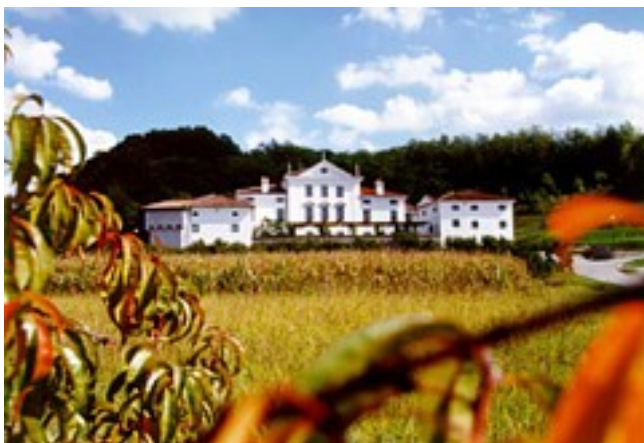
Slika 15: Dvorec Vogrsko