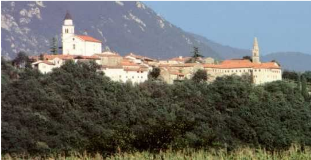
Slika 10: Vipavski Križ

razvojnih prednosti. Zato je zaostalo v razvoju in po pomenu ga je kmalu prehitela Ajdovščina.