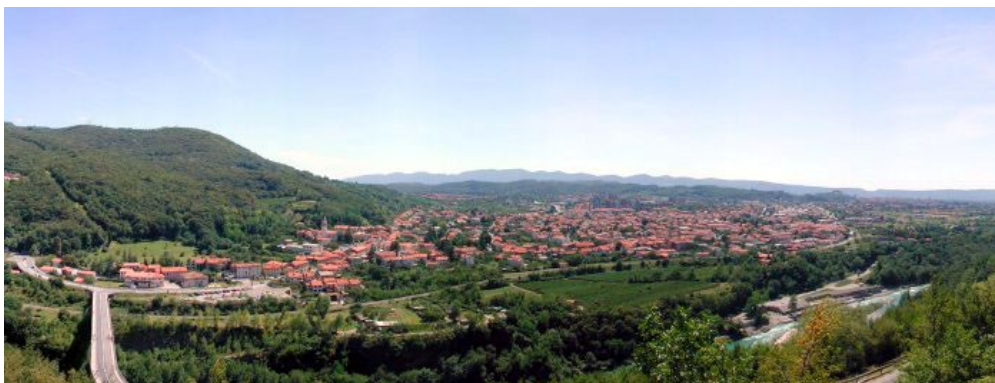
Slika 7: Solkan

Solkan , nekdanje predmestje Gorice in danes Nove Gorice, je starodavno naselje, nastalo na prometno in strateško izredno pomembnem kraju, kjer Soča med strmimi pobočji Svete gore in Sabotina izstopi iz ozke doline na odprto Goriško ravan. Po letu 1947 je bil središče goriškega okraja s sedeži gospodarskih podjetij, upravnih služb in kulturnih ustanov. Z nastankom Nove Gorice je številne dejavnosti izgubil, bil nekaj časa priključen Novi Gorici, od leta 1988 pa je ponovno samostojno naselje.