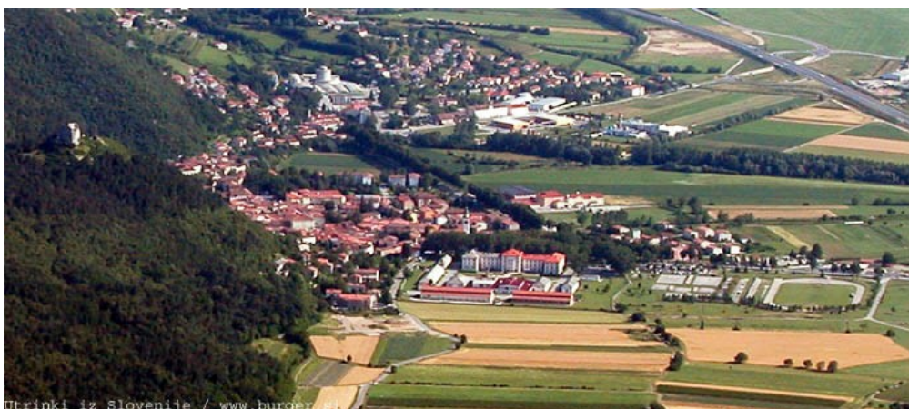
Slika 9: Vipava

Vipava je središče zgornjega dela Vipavske doline. Zaradi lege ob povirnih krakih reke Vipave jo imenujemo tudi »slovenske Benetke«. V srednjem veku je dobila tržne pravice, vendar se pozneje ni razvila v pomembnejše mestno središče. V času Avstro-Ogrske je bila sedež sodnega okraja. Zaradi oddaljenosti od železnice in ne najbolj ugodne prometne lege se v njej ni razvila pomembnejša industrija, a že od nekdaj je veliko pomenila v vinski trgovini in bila nasploh kmetijsko središče Vipavske doline.