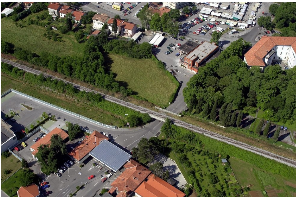
Slika 6: Meja med Italijo in Slovenijo v Novi Gorici