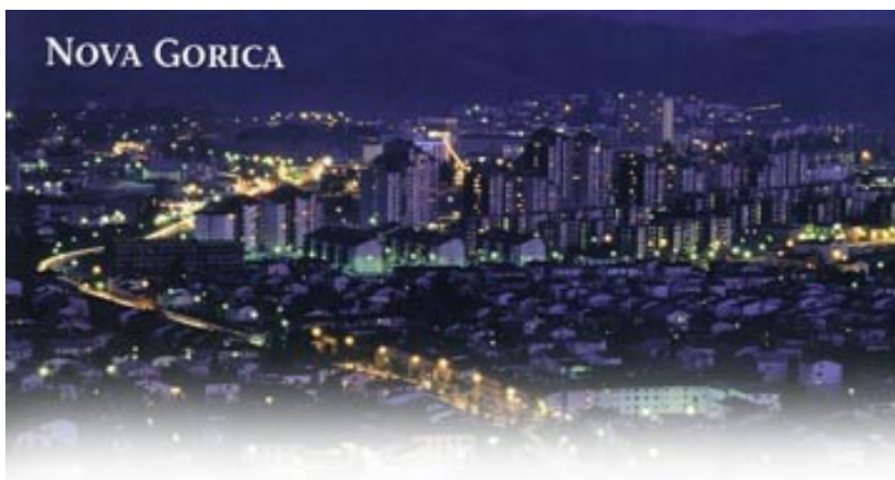
Slika 4: Nova Gorica

Nova Gorica je največje in najpomembnejše, pa tudi najmlajše naselje v pokrajini. Nastalo je po določitvi meje med Italijo in bivšo Jugoslavijo leta 1947. Nova meja je Goriško ravnino od Solkana na severu do Mirna na jugu presekala na dva dela in stara Gorica je z vsemi naselji na zahodno pripadla Italiji. Na slovenski strani sta ostali le goriški predmestji Šempeter in Solkan ter železniška postaja ob progi med Bohinjsko Bistrico in Trstom. Novo Gorico so načrtno zgradili na mokrotni ravnici ob potoku Korenu. Na južni strani mesta se dviga flišna gorica, na kateri stoji Goriški grad, ki je naselju dal ime.