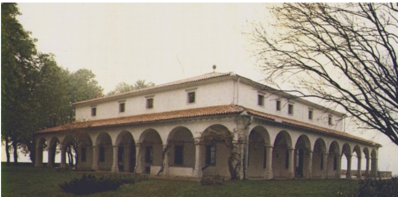
Slika 13: Dvorec Zemono pri Vipavi