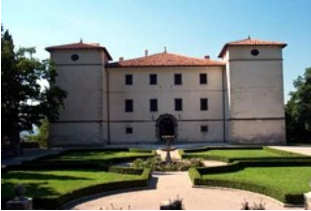
Slika 12: Grad Kromberk