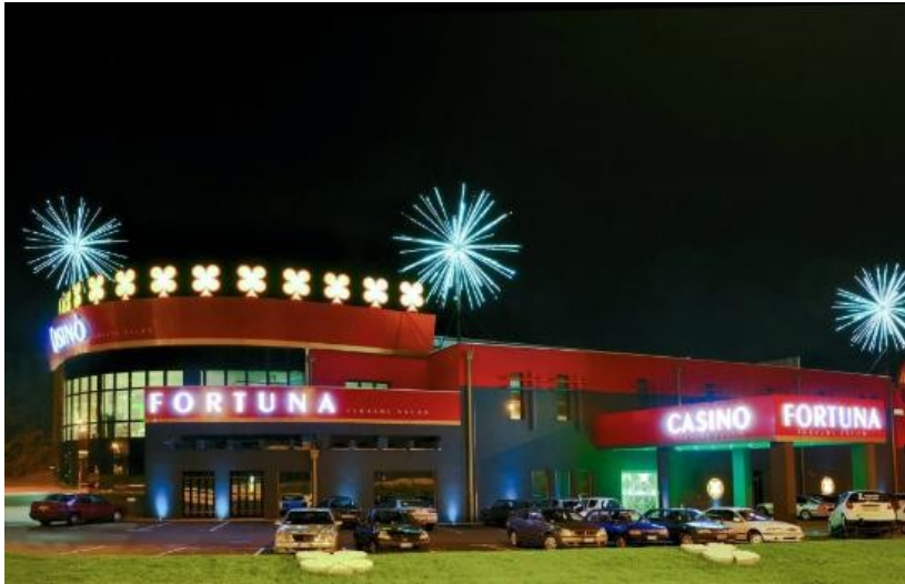
SLIKA 8: casino Fortuna v novi gorici

Turizem je razmeroma nepomembna dejavnost, a v Novi Gorici se je v zadnjih letih razvilo igralništvo in igralnice, ki jih obiskujejo predvsem Italijani.