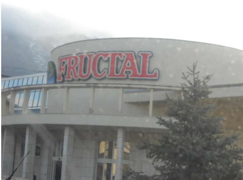
SLIKA 5: Fructal večja tovarna v vipavski dolini

Vipavska dolina najbolj slovi po izjemnem sadjarstvu in sadnih sokovih, ki jih proizvaja Fructal. Na žalost pa so se v Fructalu zaradi velikih zalog breskove kaše odločili, da letošnje letine breskev od sadjarjev v Vipavski dolini ne bodo odkupili. Trudijo se, da bi prodali sadno maso, ki so jo po lanskem odkupu uskladiščili, in če jim bo to uspelo, bodo znova odkupili vse ponujene breskve.