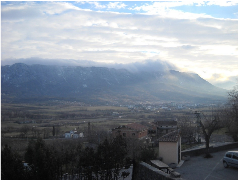
SLIKA 3: Ajdovščina večje mesto vipavske doline

Način poselitve v Vipavski dolini ustreza poselitvenim vzorcem sredozemskega vplivnega območja z gručastimi naselji in zaselki na obrobju dolin, v zavetju gričev in na nizkih vzpetinah. Najstarejša naselja stoje na gričih in ob izviroh, a nad ravnino, kjer ni bilo nevarnosti poplav.