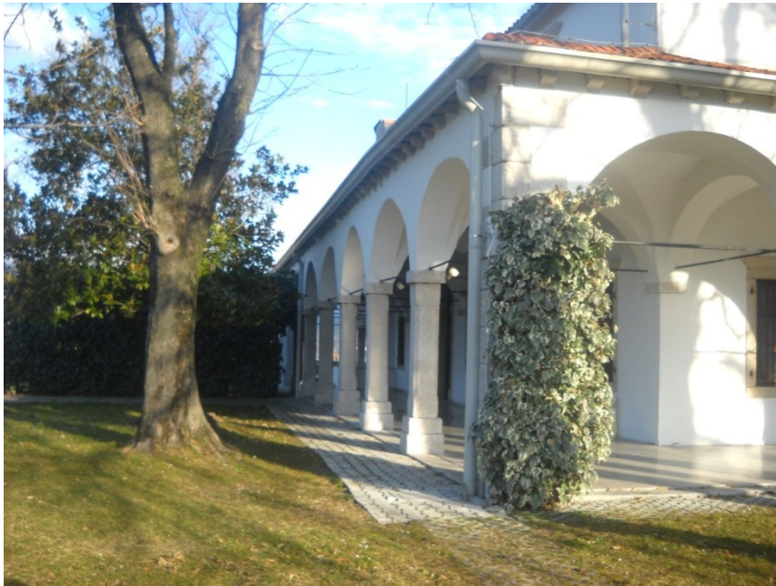
SLIKA 9: DVOREC ZEMONO

znanega meniha, pridigarja Janeza Svetokriškega.