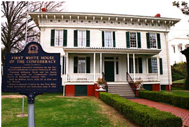
White House of The Confederacy v Richmondu.

http://www.roadstothefuture.com/Chesapeake_Bay_Bridge.html