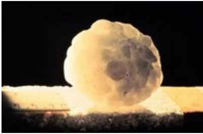
Slika 4: Zrno toče

Verjetno najdebelejšo točo pri nas pa so namerili leta 1824 na Dolenjskem, ko naj bi zrna merila v obsegu 27 cm, tehtala pa so 323 g.