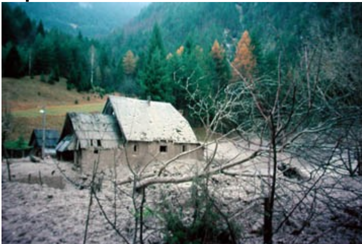
Slika 3 : Poplava

S poplavami je ogroženih več kot 3000 km 2 oziroma slabih 15 % površine državnega ozemlja. Polovica poplavnih območij je v porečju Save, v porečju Drave štiri desetine, 4 % pa v Posočju. Poplave ogrožajo predvsem hudourniške grape, dolinska dna in aluvialne ravnice, ki so marsikje pozidane. Kar 25 km 2 pozidanih površin je ogroženih. Naše ozemlje so poplave prizadele v letih 2000, 1998, 1990, 1972, 1954, 1933, 1926, 1925, 1923, 1910, 1901, 1851 in 1550. Poplave nastanejo zmeraj ob obilnem deževju, ko tla zaradi namočenosti niso dovolj vpojna, vsa padavinska voda pa ne more odteči dovolj hitro. Tako je iz Zgornjega Posočja znan primer, ko so v