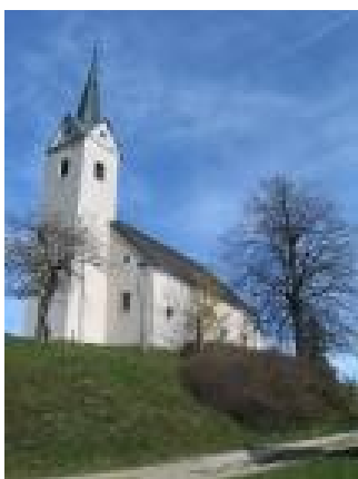
Cerkev sv. Antona na Pohorju

Ko pri Vuhredu prečkamo Dravo in se začne terasa ob njej strmo dvigovati proti vrhovom Pohorja, stopimo v čudoviti svet Sv. Antona na Pohorju. Osrednji del kraja, ki se razprostira na 2147 ha površine in premore nekaj manj kot 250 prebivalcev, predstavlja mogočen čok, ki doseže najvišjo točko 854 m pri cerkvi Sv. Antona. Ta vrh se preko sedla veže na greben, ki seže pod sam vrh Pohorja ob vznožje smučišča Kaštivnik.