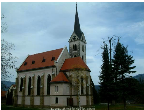
Cerkev Sv. Lovrenca v Vuhredu

Cerkvico sv. Lovrenca so v času kuge, leta 1668, zaobljubili tukajšnji prebivalci in šele leta 1701 je bila končana. Bila je podružnica vuzeniške nadžupnije. Šele leta 1788 je prišel novi duhovnik, ki se je imenoval kurat, kar bi pomenilo oskrbnik. Samostojna župnija je Vuhred postal šele leta 1891. Župnišče pa so pozidali ravno sto let prej. Ker je bila župnija ali kuracija, kakor se je prej imenovala, revna, so se duhovniki pogosto menjavali. Današnji dan pa je cerkev sv. Lovrenca turistična točka, ki jo z leti obiskuje vedno več turistov.