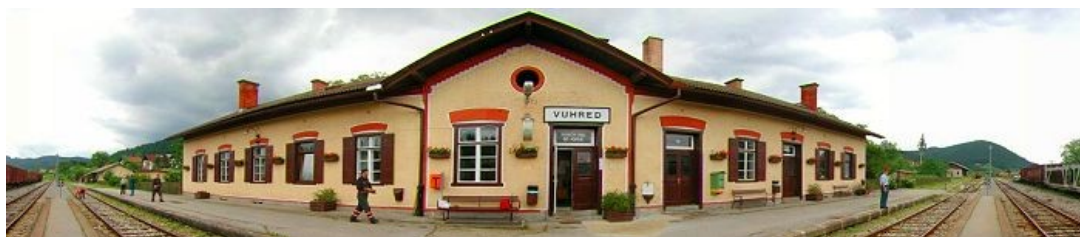
Železniška postaja Vuhred

V letu 1863 je bila speljana in zgrajena železniška proga, ki je povezala kraje ob Dravi. V letih okoli 1948 se je splavarjenje po reki Dravi zaključilo. Začeli so graditi hidroelektrarno v Vuhredu, s tem pa je nastalo tudi akumulacijsko jezero. Kraj je dobil novo urbanistično podobo, zrasli so stanovanjski bloki in številne hiše, izboljšala se je oskrba z električno energijo in vodo.