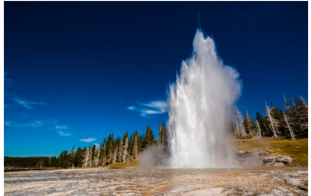
Slika 5: Gejzir