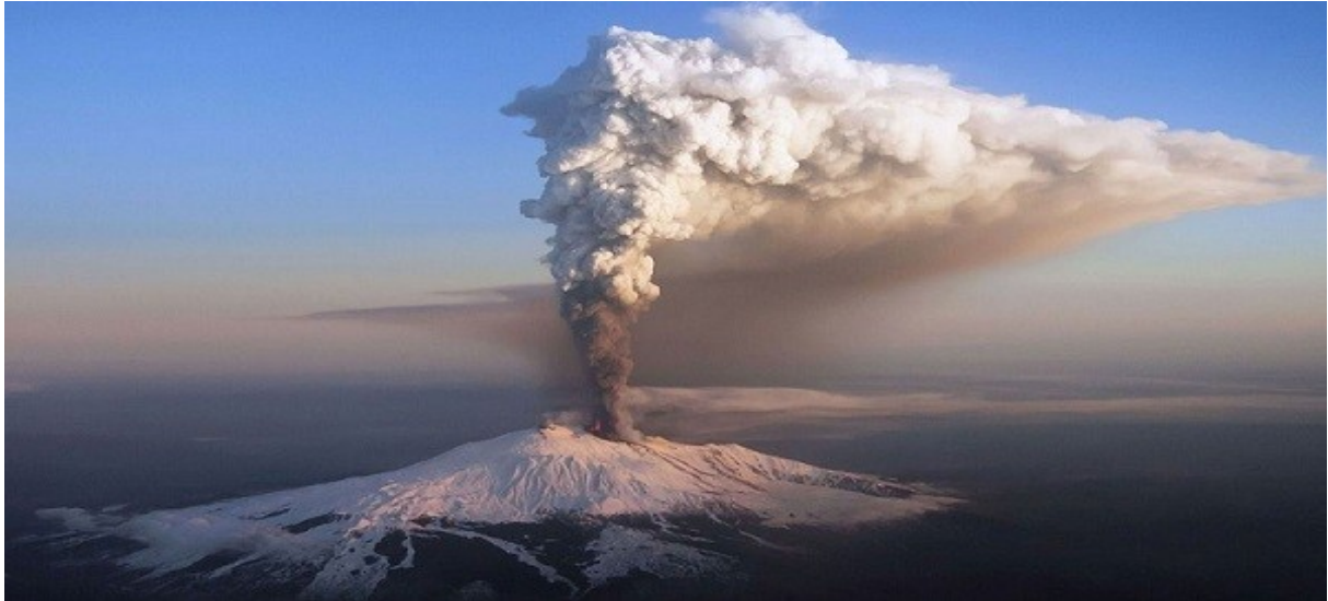
Slika 2: Izbruh vulkana Etna

Etna je 3323m visok aktiven vulkan na vzhodni obali Sicilije, med mestoma Messina in Catania. Izbruhi si sledijo vsakih nekaj let, zadnji je bil leta 2002. Zaradi stalnega nadzora in majhne silovitosti izbruhov ti navadno ne terjajo človeških žrtev, pogosto pa potoki lave uničijo hiše in vrtove. Ob enem zadnjih izbruhov so tok lave preusmerili v bližnjo nenaseljeno dolino in tako rešili vas pred uničenjem.