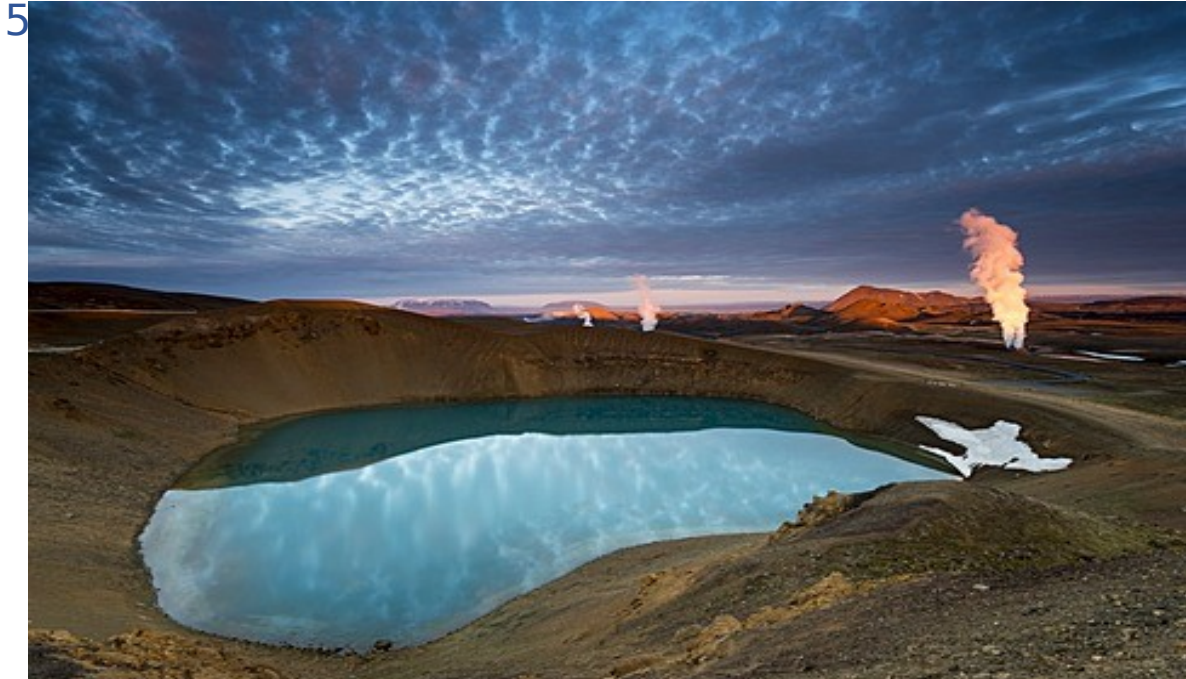
Slika 4: Vulkan Krafla

Krafla je vulkan, ki ima premer približno 10km. Njen najvišji vrh sega do 818m. Izbruhnil je 29 krat in sega 2km v globino. Krafla vključuje eno od dveh najbolj znanih Viti kraterjev v Islandiji. Islandski izraz "víti" pomeni "pekel". V nekdanjih časih, so ljudje pogosto verjeli, da je pekel pod vulkanom. V Kraflinem območju vključujemo geotermalna območja z vrelini bazeni blata in soparnimi fumarolami. Zadnji vulkanski izbruh na Krafli se je zgodil leta 1984. Od leta 1977 je bila geotermalna energija Krafle uporabljena pri proizvodnji elektrarne.