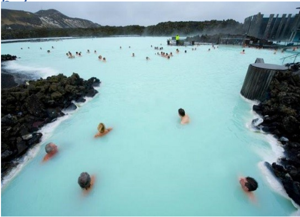
Slika 6: Termalni vrelec

Najbližje vrelcem se pojavljajo mahovi, ki so poleg alg najbolj preprosta rastlina, sledijo trave in nazadnje drevesa. Najbolj pogosta rastlina je rumena opičja roža. Ker pa je v vrelcih tako vroče, lahko rože rastejo tudi, ko je okolje na debelo pokrito s snegom.