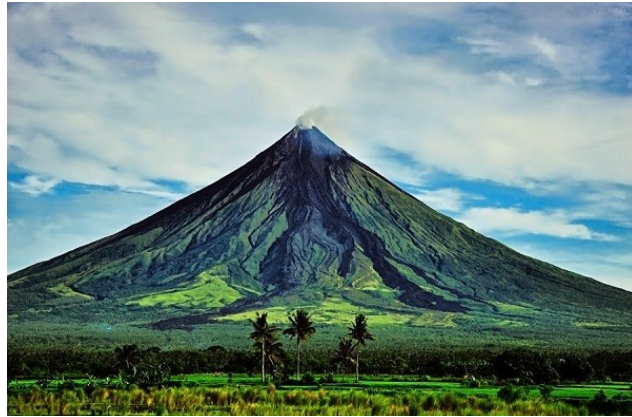
Slika 7: Mount Mayon

Največja želja »vulkanskih turistov« je ogled vulkana Mount Mayon na Filipinih, ki je eden najbolj aktivnih ter tudi najlepših vulkanov. V ZDA (v zvezni državi Washington) je vulkan Mount Rainier, ki je dejaven vsakih 500 – 1000 let in ker je od zadnjega izbruha minilo že več kot 500 let, je tarča turistov. Zaenkrat je še prekrit s snegom in ledom. V Evropi pa je tarča turistov vulkan Etna, ki leži na vzhodni obali Sicilije in je zaradi izbruhov, ki si sledijo vsakih nekaj let, zelo priljubljen.