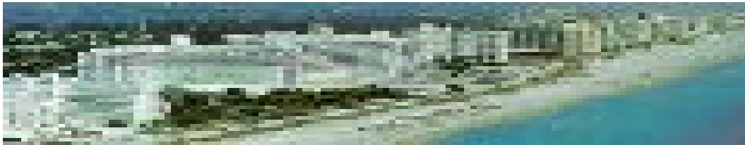
SLIKA 2: MIAMI

jugu, ki ga sestavljajo države Arkansas, Kentucky, Severna Karolina, Tennessee, Virginija in Zahodna Virginija, ima večina prebivalcev angloseksonske, protestantske korenine. To območje, ki ga imenujejo tudi »biblijski pas«, ker je večina prebivalcev skrajno verna in konservativna, lahko glede na razvoj prištevamo k severu. To je dežela gozdov in dolin in dežela country glasbe. Nashville v državi Tennessee je vse do danes Meka country glasbenikov in ljubiteljev te glasbe.