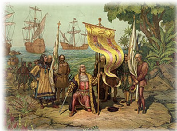
Slika 9. - Krištof Kolumb ob iskanju zahodne poti v Indijo naleti na ameriško celino in s tem prične dobo mogočne ter agresivne nadvlade zahodnega sveta nad ameriški in afriškimi staroselci.