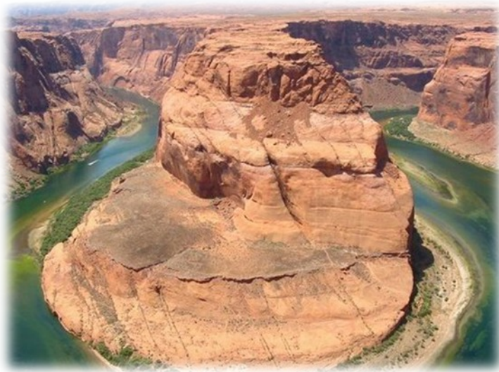
Slika 6. – Grand Canyon

mednarodni jezik. Kljub temu imajo ZDA znatne družbene in gospodarske težave; organizirani kriminal, korupcija v politiki in potratno izkoriščanje naravnih virov so prav tako značilni za ameriški družbo kot pristanek na Mesecu, medicinska odkritja, Philadelphijski orkester, Hollywood in Mišek Miki.