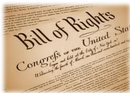
Slika 12. – Bill of Rights/