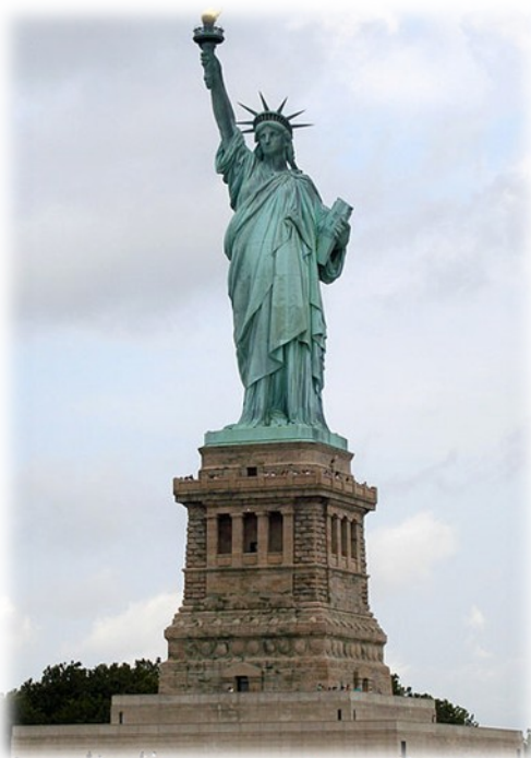
Slika 1. - Kip svobode ali po angleško Statue of Liberty , s polnim imenom Liberty Enlightening the World predstavlja boginjo svobode, ki v iztegnjeni roki drži baklo, je eden najznačilnejših ameriških simbolov.

»Daj mi svoje utrujene, uboge, tlačene množice, ki hrepenijo po svobodi piše na kipu svobode v newyorškem pristanišču. Kip so zgradili leta 1886, del denarja pa so prispevali Francozi v znamenja prijateljstva z ZDA. Številnim generacijam evropskih priseljencev je kip pomenil prvi pozdrav in znamenje , da so srečno prispeli v deželo nešteti priložnosti.«