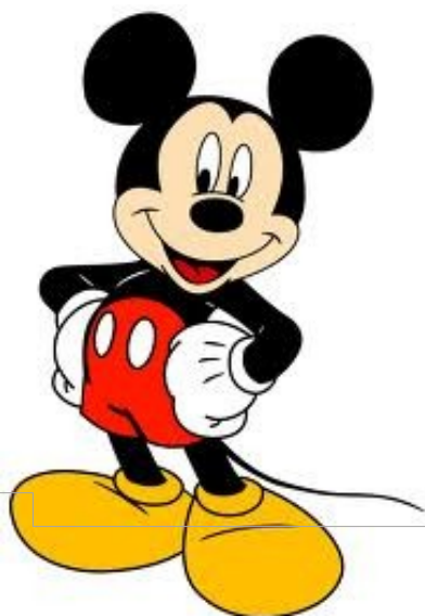
Slika 8. – Miki Mouse