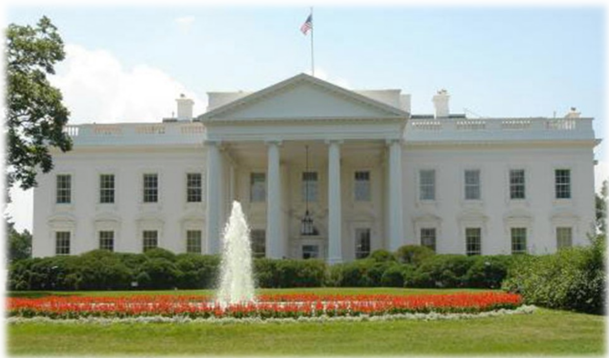
Slika 4. – Bela hiša (uradna rezidenca predsednika ZDA)