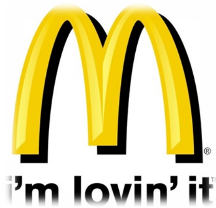
Slika 16. – Mc Donald's

Tako kot druge ameriške kulturne sestavine je tudi ameriške kuhinja kontradiktorna: na eni strani zaradi pestrosti priseljencev uživa kvalitete mnogih svetovnih kuhinj, na drugi strani pa je široko priljubljeno in prakticirano uživanje kulturno in prehrabno ne-polnovredne hrane v restavracijah s hitro prehrano.