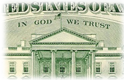
Slika 3. – In God We Trust