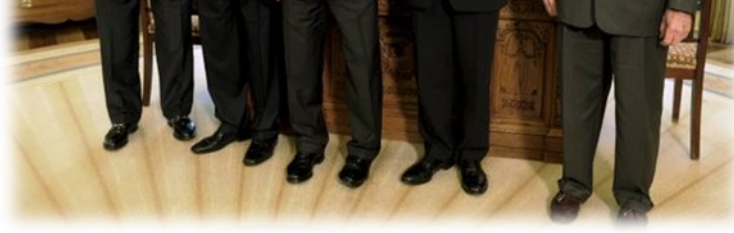
Slika 13. – Vsi še živeči bivši predsedniki ZDA s sedanjim predsednikom Barackom Obamo