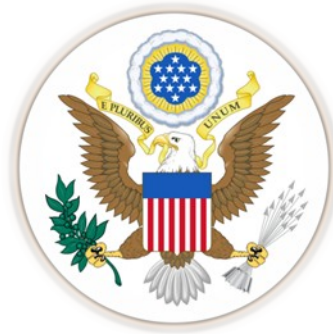
Slika 2. – E Pluribus Unum