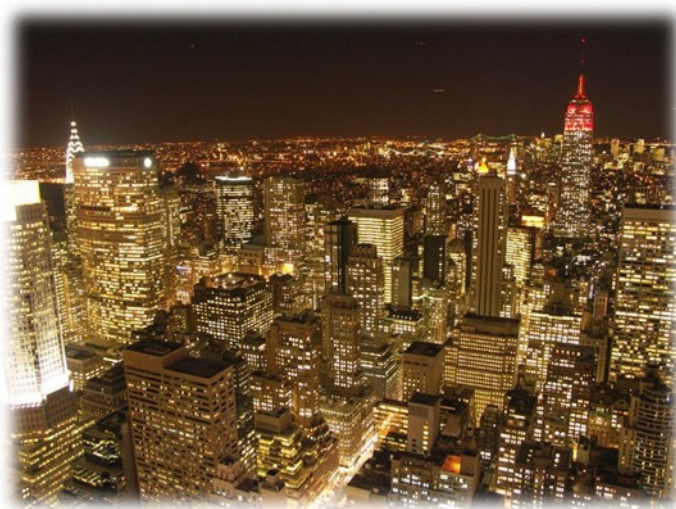
Slika 7. – New York