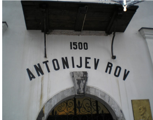
vhod v muzej

Eden največjih rudnikov živega srebra na svetu je zaradi svoje izjemnosti že v času delovanja privabljal raziskovalce in popotnike iz vse Evrope. Dandanes, ko se rudnik postopoma zapira, je iz dneva v dan več tistih, ki bi si želeli ogledati podzemni svet idrijskega rudnika- ANTONIJEV ROV .