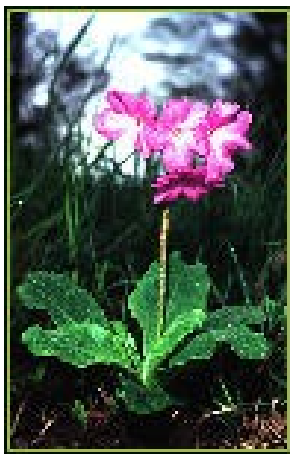
kranjski jeglič ( Primula carniolica )