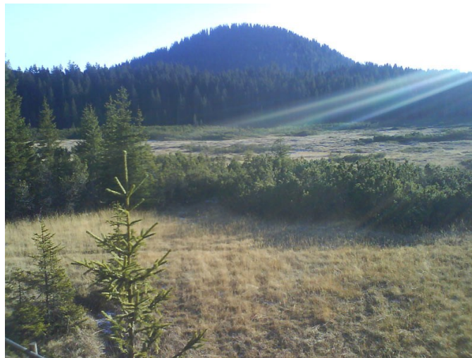
Slika 6: Barje Šijec

Vzpeli smo se na Pokljuko, Pokljuka je gozdnata planota v Vzhodnih Julijskih Alpah. Leži med dolinama Radovna in Krma. Jugovzhodni rob planote se strmo spusti proti Savi Bohinjski. Zaradi intenzivnega oglarjenja za potrebe razvijajočih se fužin na območju Bohinja so bili v 18. stoletju obsežni pretežno bukovi in jelovi gozdovi na Pokljuki izsekani. Pozneje se je pogozdovalo pretežno s smreko, ki je danes prevladujoča drevesna vrsta na Pokljuki. Od Mrzlega Studenca smo pot proti pokluskim barjem nadaljevali peš. Najprej smo si ogledali nizko barje. Nizko barje je bogato z mineralnimi snovmi, ker na njem najdemo vodo. Na njem najdemo nizkobarjanske rastline: kalužnica, brusnica, borovnica... Bolj natančno pa smo si ogledali visko barje - Barje Šijec. Visko barje je mrzišče, saj bi morale biti temperature višje, kot dejansko so. Na območju barja je bil najprej ledenik, ki je izdolbel kotanje v katerih so bila kasneje jezera, nato pa so se v njih nabirali sedimenti in šota. Šotni mah raste, pod njim pa se kopiči šota. Značilne viskokobarjanske rastline so šotni mah, ruševje, okroglostna rosika (mesojedka), rožmarinka munc Barje je kislo (pH med 3,4 in 4,2) zato, ker šotni mahov Slika 5: Območje TNP-ja Temperatura močno niha, sv malo, zato so rastline izjemo prilagojene.