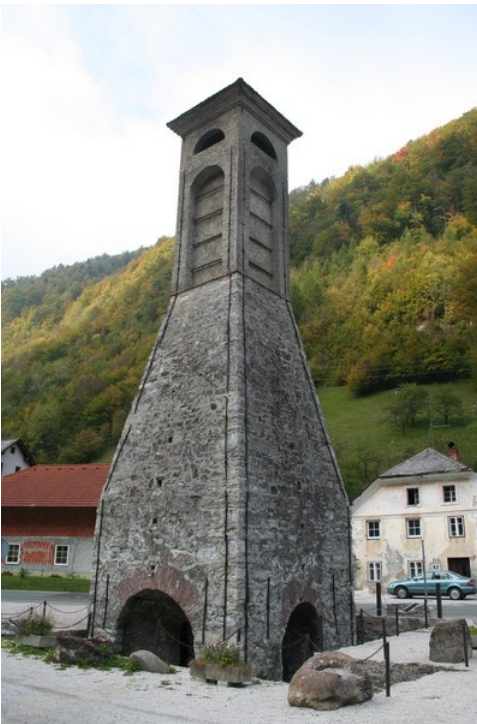
Slika 10: Plavž

Železnikih stoji najbolje ohranjen plavž v Sloveniji, ki je deloval do leta 1902. Leta 1426 sta v Železnikih delovala 2 plavža, leta 1575 pa so Železniki postali trg. Obiskali smo Muzej Železniki , ki se nahaja v središču starega dela Železnikov, v stari fužinarski hiši iz 17. stoletja. Muzej je posvečen predvsem 600-letni zgodovini železarstva v Selški dolini. Do zamrtja železarstva zaradi konkurence večjih podjetij so bili glavni izdelek žebli. Dobavljali so jih v sodčkih (bariglah). V enem sodčku je bilo do 18.000 žebeljev srednje velikosti. Preko tržaške luke so žeblje prodajali po celem svetu. V muzeju je predstavljen celoten postopek, od kopanja železove rude, njenega transporta in taljenja v plavžu, predelave surovega železa v fužini v polizdelke ter izdelava končnih izdelkov v kovačnici ali vigenjcu. Poleg železarske zbirke so v muzeju še lesarska zbirka (izdelovanje sodov kot embalaže za železarske izdelke), zgodovina čipkarstva (pojavi se po zamrtju železarstva), izdelava strešne kritine iz skrila, življenje kraja in okolice (društva, NOB, spominska soba akademika prof. dr. Franceta Koblarja). Ogledali smo si tudi slike jesenske poplave v Železnikih in razdejanja po njej.