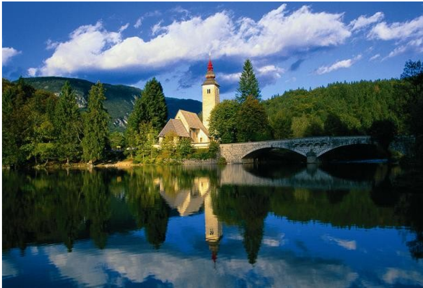
Slika 8: Bohinjsko jezero in cerkev v Ribčevem lazu

Središče občine Bohinj je Bohinjska Bistrica. V naselju se začne Bohinjski železniški predor, ki Gorenjsko povezuje s Primorsko. V Bohinjski Bistrici pa je tudi smučarsko središče Kobra.