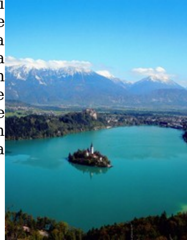
Slika 7: Bled

Peljali smo se nazaj skozi Gorje in nadaljevali pot mimo Bleda . Naravne in zgodovinske znamenitosti, lepota kraja in okolice ter dobra geografska lega so bili idealna osnova za razvoj Bleda v enega največjih turističnih centrov v Sloveniji. Leži v delu Ljubljanske kotline, imenovanem Blejski kot. Največje znamenitosti kraja so Blejsko jezero z otokom na katerem je cerkev in grad, ki se stoji na vzpetini nad jezerom.