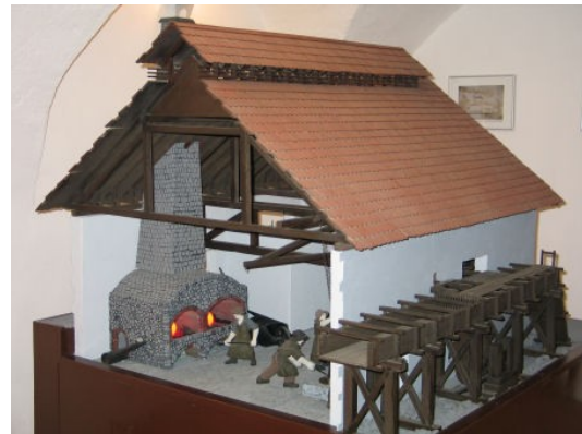
Slika 9: Maketa fužine

Južno od Železnikov se dviga Škofjeloško hribovje , ki obsega Selško in Poljansko dolino ter hribovja nad njima, Žirovsko kotlino ter Sorško polje. Posebno veljavo regiji daje Škofja Loka , mesto ob sotočju obeh Sor, ki je tudi gospodarsko, kulturno in upravno središče regije.