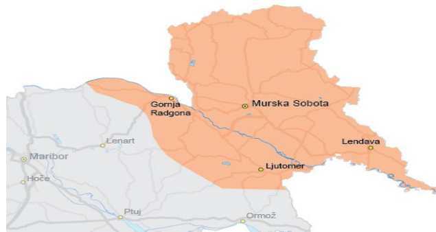
Slika 1: Zemljevid Pomurja

priređijo radgonski kmetijski sejem, ki je največja tovrstna prireditel v Sloveniji.