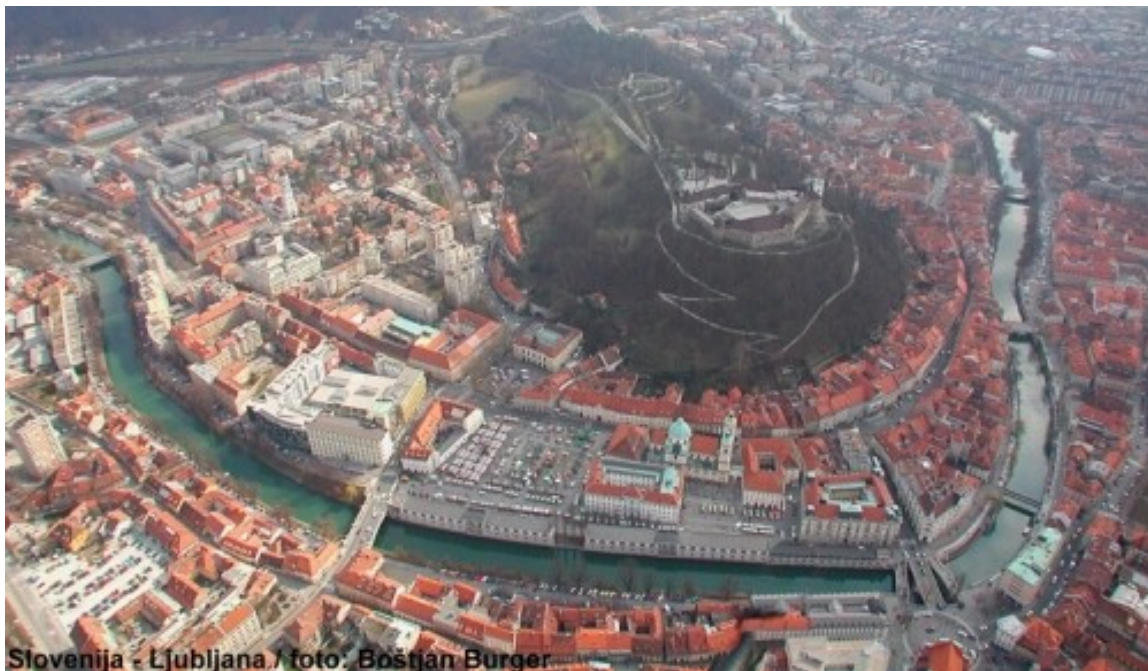
Slovenija - Ljubljana

Maturitetno terensko delo v domači pokrajni