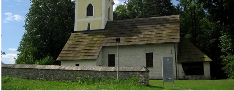
Slika 6: Cerkev sv. Jurija

Pot smo nadaljevali skozi Dravograd. Dravograd leži ob sotočju Drave z Mežo in Mislinjo, oziroma na stičišču njihovih dolin. Iz starega trškega sejemskega jedra pod nekdanjim starim gradom je prerasel v moderno naselje, ki ga reka Drava deli na levi in desni breg. Kraj z nekdanjo mitnico je kasneje postal pristan za dravsko brodarstvo, še pozneje pa večje železniško križišče.