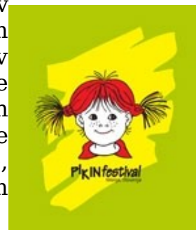
Slika 4: Pikin festival

Peljali smo se naprej, skozi Velenje , drugo največje mesto v Sloveniji, zgrajeno po 2. svetovni vojni. Območje današnjega Velenja je bilo prvič omenjeno leta 1250. Trg Velenje se v dokumentih prvič omenja leta 1264, nad starim trškim jedrom pa že stoletja gospoduje grad, ki je v zgodovinskih virih prvič omenjen leta 1270. Nekoč je bila za mesto pomembna lesna industrija in prevoznništvo, kasneje pa premogovništvo. Danes je Velenje znano predvsem po tovarni Gorenje, premogovniku, Pikinem festivalu in lepo urejenem gradu.