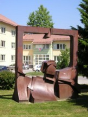
Slika 10: Forma Viva v Ravnah na Koroškem

Ob reki Meži smo se peljali do Raven , industrijskega in železarskega središča Koroške. To je najbolj poseljen del Koroške, kjer se mesto Ravne že stika z sosednjimi Prevaljami. Danes so Ravne največje koroško mesto, so upravno, gospodarsko, izobraževalno, športno in kulturno središče Mežiške doline (dolina reke Meže). Osnova za razvoj je bilo jeklarstvo, ki je šele s propadom fužinarstva v Črni, Mežici in na Prevaljah dobilo možnost za nadaljnji razvoj. Kraj je znan tudi po Forma Vivi, zbirki monumentalnih kiparskih skulptur iz jekla, ki krasijo urbane elemente mesta in okoliških krajev. Peljali smo se skozi Prevalje , ki so bile v preteklosti znane predvsem po izdelovanju železniških tirov. V občini Prevalje se nahaja tudi nekoč rudarski kraj Leše , nad katerim stojita Leški dvojčici, gotski cerkvi sv. Ane in sv. Volbenka, ki sta postavljeni zelo skupaj.