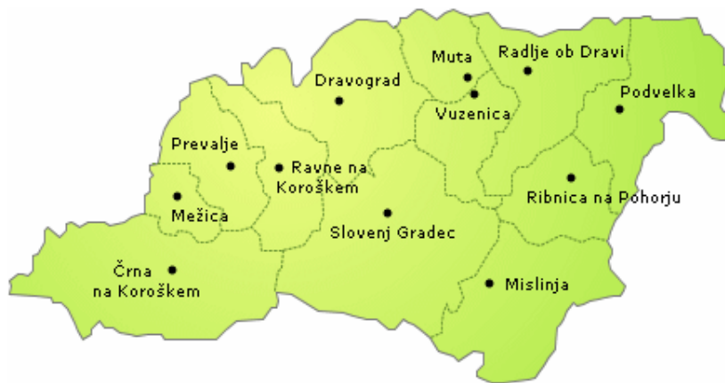
Slika 1: Koroška

V četrtek, 18.9.2008 smo se odpravili na ekskurzijo na Slovensko Koroško. Koroška obsega območje treh dolin – Mežiške, Dravske in Mislinjske ter treh pogorij – Pohorja, Karavank in Savinjskih Alp. Z nad 1000 km 2 in nad 74 000 prebivalci sodi pokrajina med manjše slovenske regije. Je ena najstarejših slovenskih industrijskih regij. V prejšnjih stoletjih se je tu razvilo rudarstvo, baje so tu rudarili že v rimski dobi; za njim pa sta se razcvetela železarstvo in lesna industrija. Koroška danes obsega 12 občin, od katerih jih kar 9 meji na Avstrijo.