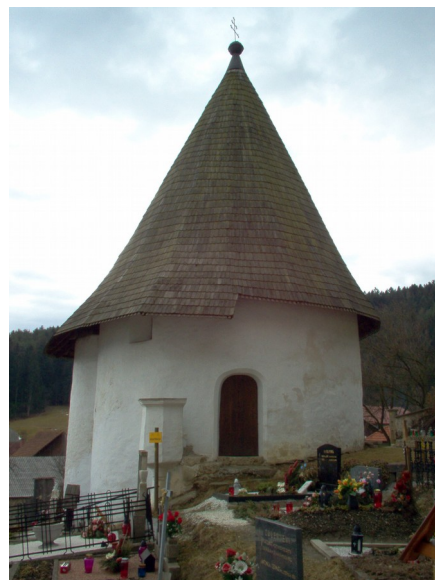
Slika 7: Kostnica

Peljali smo se vse do meje z Avstrijo, v kraj Libeliče, ki se lahko pohvali s kar nekaj znamenitostmi. Libeliče so preprosta kmečka vas, stara okoli 800 let. Vas je iz ene strani zaprta z reko Dravo, z druge z Libeliško goro in s tretje z Avstrijsko mejo. Najprej smo si ogledali cerkev sv. Martina. Cerkev je v preteklosti pogorela in bila dvakrat porušena. Obnovili so jo leta 1792. Poleg cerkve se nahaja kostnica. V preteklosti, je bilo pokopališče premajhno, da bi lahko pokopali vse ljudi iz vasi, ki so spadale pod Libeliče. Grobove so začeli prekopavati, ker niso želeli, da bi kosti nečastno ležale naokrog. Poleg cerkve so zgradili majhno okroglo stavbo, razdeljeno na dva dela. V zgornjem delu je bila kapela sv. Mihaela, v spodnjem pa kostnica, kamor so shranjevali kosti umrlih. V Sloveniji so ohranjene samo tri kostnice, od katerih je najlepše