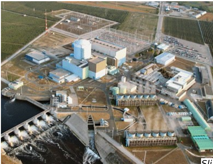
Slika 5: Nuklearna elektrarna Krško

V novem veku je bilo mesto pomembno zaradi trgovine ter plovbe po Savi. Danes pa se ukvarjajo predvsem z lesno in papirno industrijo. V Krškem pa stoji tudi edina slovenska jedrska (nuklearna) elektrarna, ki proizvede 40% vse električne energije v Sloveniji. Temeljni kamen je bil položen 1.12.1974, deluje pa od leta 1981. Financirali sta jo Slovenija in Hrvaška, zato prihaja tudi do sporov med državama, saj je Slovenija prevzela vse jedrske odpadke. V Krškem pa je bila leta 1952 izmerjena doslej najvišja temperatura v Sloveniji, 40,7°C.