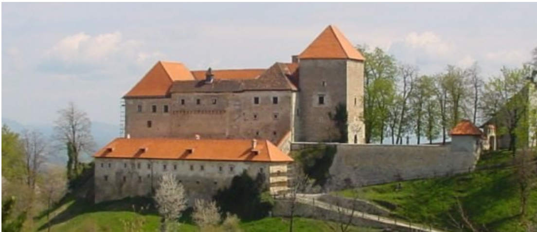
Slika 11: Grad Podsreda

Z ogledom gradu smo našo ekskurzijo zaključili in se imo Brestanice in Krškega ter naprej po dolenski avtocesti vrnili nazaj v Kranj.