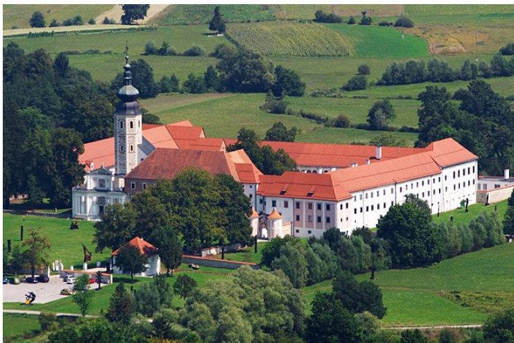
Slika 7: Cistercijanski samostan v Kostanjevici na Krki