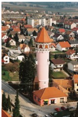
Slika 9: Vodovodni stolp Brežice

Brežice (162m, 7000 prebivalcev) so mesto z bogato zgodovino. V Brežicah stoji Brežiški grad, v bližini pa je tudi grad Mokrice. Mestne pravice so dobile leta 1322. Mesto je imelo v preteklosti pomembno obrambno vlogo, predvsem v času turških vpadov in kmečkih uporov. V vseslovenskem kmečkem uporu leta 1515, sta grad in mesto pogorela. Grad so prenovili in v hrvaško-slovenskem kmečkemu uporu leta 1573 je kmetom uspešno kljuboval. Znamenitost mesta pa je tudi vodovodni stolp.