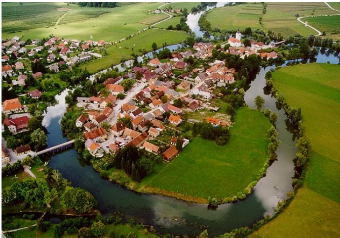
Slika 6: Kostanjevica na Krki

V samostanu je danes Galerija Božidar Jakac. Že leta 1956 je bila na pobudo tedanjega ravnatelja na osnovni šoli ustanovljena Gorjupova galerija. Leta 1961 se je na samostanu prvič odvijal mednarodni simpozij kiparjev, Forma viva. Na njem kiparji na vsake dve leti izdelujejo kipe iz hrastovega lesa. Ko je zbirka na osnovni šoli postala prevelika, so jo leta 1974 prestavili v samostan, kjer je začela delovati Galerija Božidar Jakac. Božidar Jakac (1899 - 1989) je bil slovenski slikar in grafik, ki je prvi podaril dela za galerijo. Podaril je okoli 300 grafik, danes pa so razstavljene samo tiste iz njegovega študentskega obdobja. Študiral je v Pragi, razstava pa je razdeljena na dva dela - mestni in kulturni utrip.