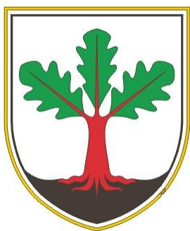
Slika 3: Grb občine Hrastnik, ki predstavlja hrast, ki je zrasel iz črnih tal (premog)

Pot smo nadaljevali mimo zdraviliškega kraja, Rimskih Toplic. Rimske Toplice spadajo v občino Laško, razcvet pa so doživele v 2. polovici 19. stoletja, ko je bila zgrajena večina zdraviliških objektov. Ime Toplice so dobile po termalni vodi (ima okrog 37°C in je bogata z ogljikovo kislino), ki izvira izpod Stražnika. Ko so pri širjenju kopališča našli rimske ostanke, so kraj poimenovali Rimske Toplice. V bližini je tudi domačija slovenskega pesnika Antona Aškercu.