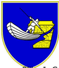
Slika 1: Grb občine Litija, z ladjo (brodarstvo) in Vaško situlo

Po levem bregu Save smo se peljali mimo geometričnega središča Slovenije (GEOSS), ki leži v neposredni bližini Spodnje Slivne in Vač, kjer so leta 1822 odkrili Vaško situlo, ki jo danes hrani Narodni muzej Slovenije. Situle so bronasta vedra, okrašena z reliefnimi upodobitvami. Pot smo nadaljevali mimo Litije. Litija se je razvila iz nekoč pomembne brodarske postojanke na reki Savi. Tok reke so leta 1726 regulirali in po njej so pluli večji čolni, ki jih je vlekla živina. Od trgovcev so pobirali mitnino. Na gospodarski razvoj Litije, zlasti rudarstva, tekstilne in lesne industrije je zelo ugodno vplival prihod Južne železnice po letu 1849, a so z njenim prihodom hkrati zamrle številne dejavnosti in obrti tesarstvo, barvarstvo, vrvarstvo, povezane z rečnim ladjarstvom. Današnje mesto se razprostira na obeh bregovih reke Save in šteje približno 7.000 prebivalcev. Južno od Litije leži renesančni grad Bogenšperk, eden najpomembnejših kulturnih spomenikov na Slovenskem. V 17. stoletju ga je kupil J. V. Valvasor, ki je na njem živel 20 let. Na gradu je imel svojo tiskarno in bakroreznico. Njegovo najbolj znano delo je Slava vojvodine Kranjske, ki je izšla v Nürnbergu leta 1689. V njej je Kranjska predstavljena iz strani zgodovine, geografije, topografije, medicine, etnologije, biologije, geologije ... Delo je razdeljeno v 4 dele in vsebuje 528 podob slovenskih, istrskih in hrvaških krajev. Danes je na gradu muzej in poročna dvorana.