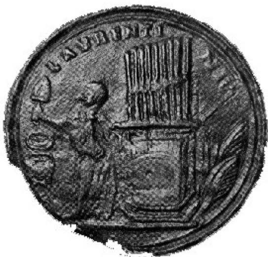
Slika 1: Kovanec na katerem lahko vidimo grške orgle.

V referatu z naslovom razlike med antično in moderno glasbo bom predstavil razlike med glasbo, glasbili, tonovskimi načini in razumevanjem glasbe danes in nekoč. Za to temo sem se odločil, ker se mi je zdela zelo zanimiva. Skušal bom odgovoriti na vprašanja: kakšna glasbila so uporabljali v antiki, ali so podobna današnjim, kako so glasbo dojemali in kje so jo uporabljali, ... Za primerjavo z moderno glasbo sem se odločil predvsem zato ker je večini bolj poznana kot klasična glasba. Nekatere razlike so vidne že na prvi pogled saj v antiki ni bila tehnologija tako napredna in niso mogli ustvarjati računalniške glasbe. Prav zaradi tega pa nam je razumevanje antične glasbe toliko težje. Moja naloga pa je, da podrobneje raziščem tudi na prvi pogled nevidne razlike. Raziskovanja sem se lotil tako, da sem vso dobljeno literaturo podrobno obdelal nato pa sem iz nje izluščil skrivnosti antične glasbe in jih primerjal z lastnostmi moderne glasbe.