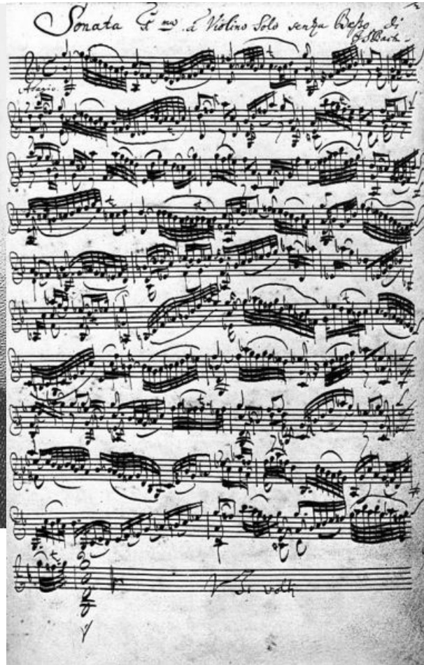
Bachov rokopis violinske sonate