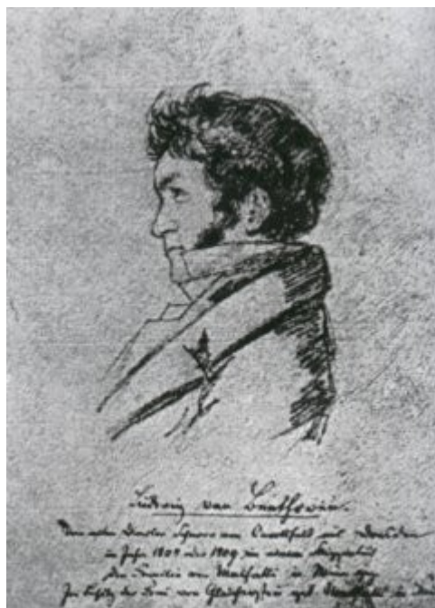
Ludwig van Beethoven v starosti 40 let Risbo s svinčnikom narisal Ludwig Schnorr von Carolsfeld (okoli 1810)