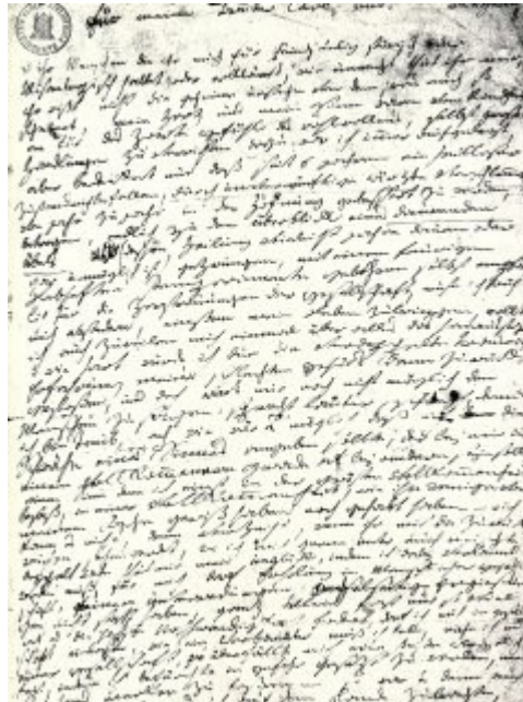
Del Beethovnovne oporoke iz leta 1802