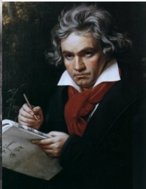
Ludwig van Beethoven (1770-1827)