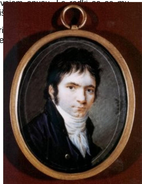
Ludwig van Beethoven v starosti 32 let Miniaturo na slonovi kosti izdelal Christian Horneman (1802).