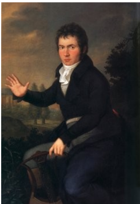
Ludwig van Beethoven v starosti 34 let Portret z oljnimi barvami naslikal Joseph Willibrord Maechler (okoli 1804).