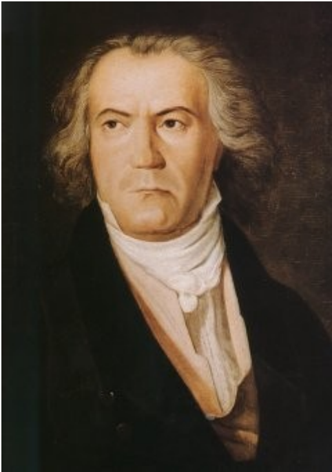
Ludwig van Beethoven v starosti 53 let Portret z olinimi barvami naslikal Ferdinand