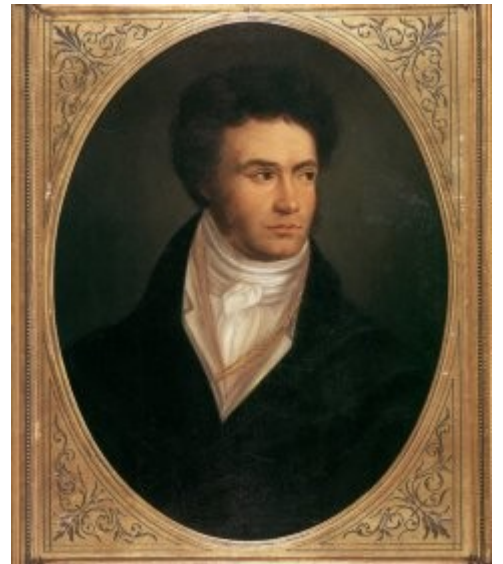
Ludwig van Beethoven v starosti 36 let Portret z oljnimi barvami naslikal Isidor Neugass