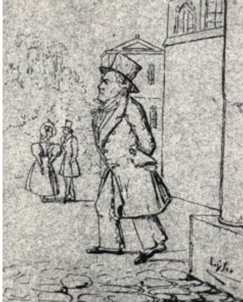
Skica Beethovna med sprehodom