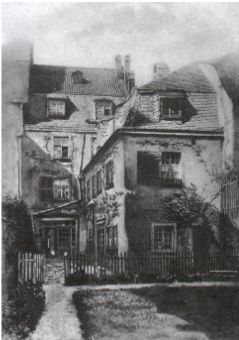
Beethovnova rojstna hiša v Bonnu

Ludwig van Beethoven se je rodil v obdobju 'pomembnih in burnih dogodkov'. Metaforično gledano se je z njegovim otroštvom rodila tudi moderna demokracija v ZDA (ameriška deklaracija o neodvisnosti je bila leta 1776, ko je bilo skladatelju 6 let in je naredil že prve korake k velikemu geniju), mladost mu je zaznamovala francoska revolucija (drug vzpon demokracije) leta 1789, svoja najboljša leta je postavil ob bok Napoleonu (1799-1816), življenje nadaljeval z delitvijo sveta (Dunajski kongres, 1814/15), vmes je prišla še ena revolucija (grška osvobodilna vojna, v kateri je padel Byron, leta 1821), z Monrojevo doktrino (1823) in Metternichovim politični terorjem pa je ugašala luč življenja tega velikana umetnosti. Ni se potrebno čuditi, da je potem skladatelj evre nihal med heroizmom in bojem proti tiraniji, ter intimno čustvenostjo v ljubezni in spoštovanju.