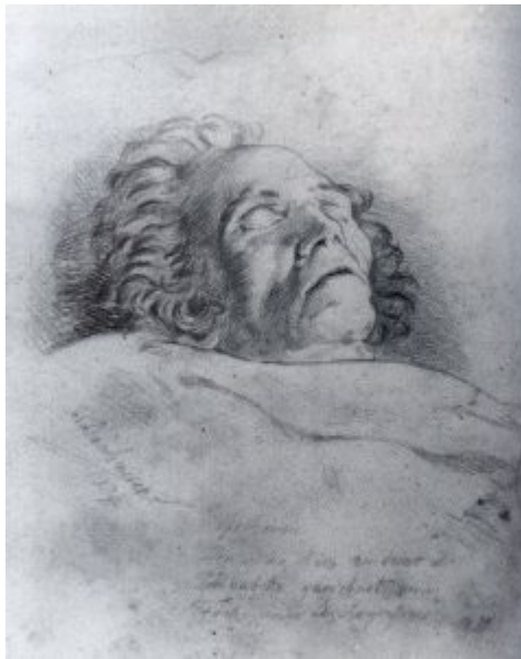
Risba mrtvega Beethovna

Pozna leta zaznamujeta teža njegovih del in zavrnjena nečakova ljubezen. Pozni kvarteti (op.130-133, 135) so globoko intimni, skoraj religiozni, Velika fuga pa je popolnoma moderna (kot, da bi jo napisal kak Stravinski ali Berg). Missa solemnis in 9. Simfonija sta zaključeno poglavje njegovega simfoničnega ustvarjanja. Kaj večjega ne bi mogel napisati nikoli več, čeprav so v predalu ležali osnutki za novo simfonijo, oratorij in celo opero. Izčrpano od nenehnih bojev z boleznijo, Johanno in boja za svobodo se je njegovo telo še nazadnje dvignilo nekaj dni pred smrtjo, ko je vzkliknil: "Smejte se prijatelji! Končana je komedija!"