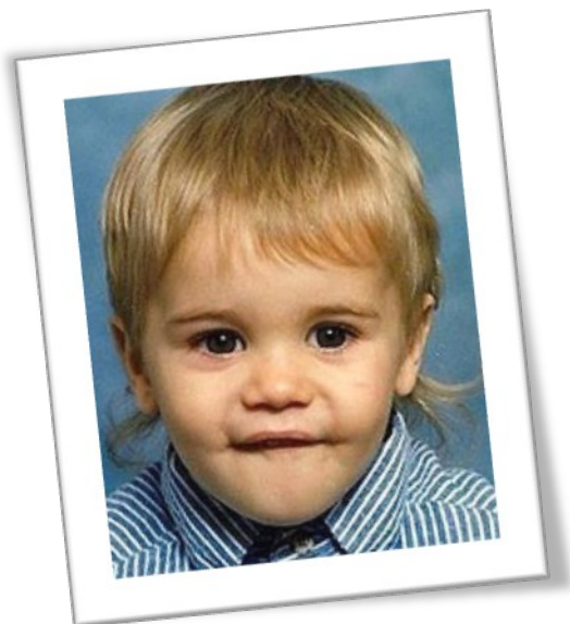
Slika št.1 : Justin ko je bil star 3 leta

To so bile njegove besede iz knjige Justin Bieber: First Step 2 Forever: MyStory (2010 by Bieber Time Books LLC, New York, USA)