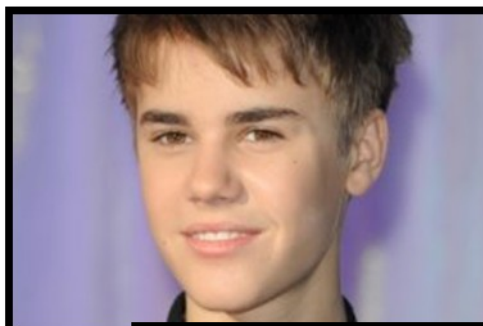
Justin Bieber v Londonu – muzej madameTussaud