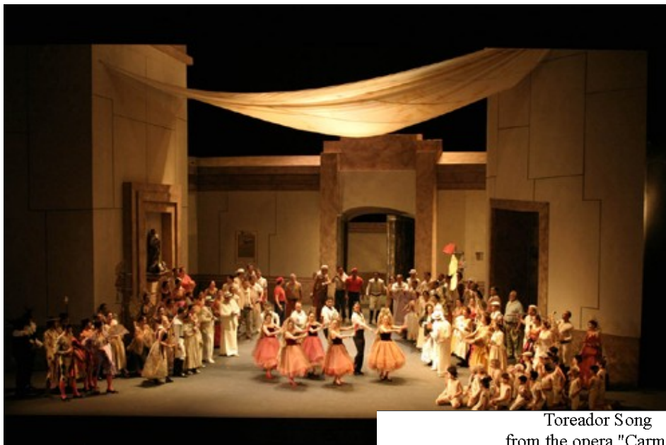
Toreador Song from the opera "Carmen"

razvedrilo, zato nehote povzroča propad številnih moških. Zapelje tudi deseterja don Joséja in ga prepriča, da se zaradi ljubezni upre svojim nadrejenim. Don José se odreče ugledu in pridruži skupini tihotapcev, med katerimi živi tudi Carmen. Sreča je kratkotrajna, saj deklica Joséja zaradi nove ljubezni zapusti. Fant izgubi razum in se krvavo maščuje. S Carmen je Bizet ustvaril edinstveno delo. Uspelo mu je napisati realistično opero, s katero se težko kosajo tudi največje mojstrovine sorodnega italijanskega verizma. Dobro oblikovani značaji in tragičnost zgodbe so zelo prepričljivi, saj temeljijo v sami glasbi – španski ritmi in ciganska melodika zarišejo močno lokalno barvo, okolje, iz katerega Carmen izhaja in mu ne more ubežati, saj povsem določa njen značaj in ravnanje. Carmen je ob premieri marca 1875 v Parizu prejela ravnodušne in hladne odzive. Mnogi so se tedaj jezili zaradi strastnosti prizorov, ki so veljali za drzne, drugi so spet menili, da je glasba prezahtevna. Ne glede na to, so opero še istega leta do skladateljeve smrti uprizorili kar triintridesetkrat. Postala je ena najbolj priljubljenih oper, kar jih je bilo kdaj napisanih. Bizet je umrl le tri mesece po premieri.