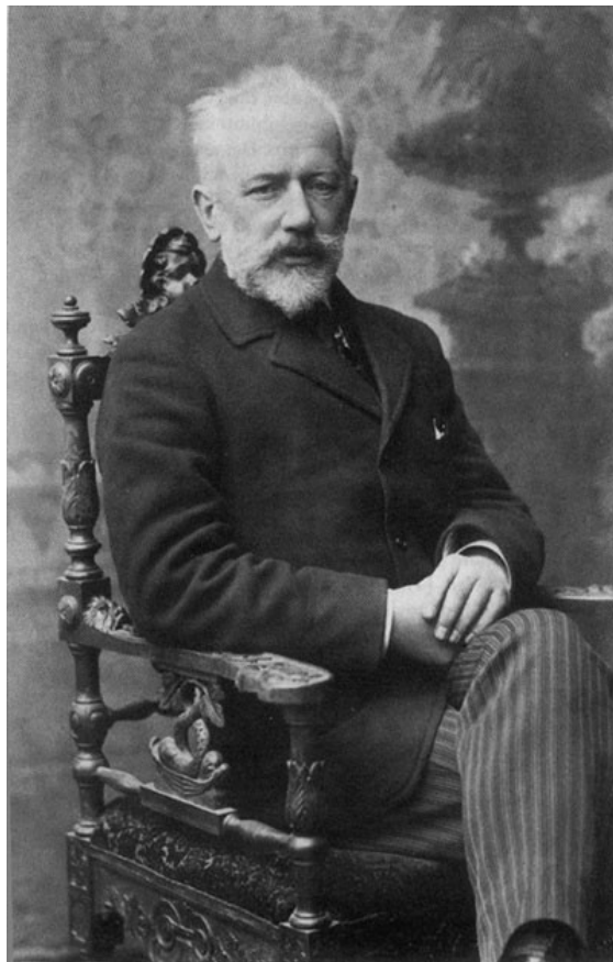
Peter Iljič Čajkovski

Glasba Čajkovskega ima vse značilnosti časa, v katerem je nastala. Ko je v svoja dela vnašal širok razpon čustev od najnežnejše lirike do pretresljive dramatičnosti, si je vedno prizadeval, da bi bila njegova glasbena govorica prepričljiva in neposredna. Toda razpet med težnjo po življenju, ljubezni in sreči ter spoznanjem, da tega ideala ni moč uresničiti in sicer zato, kot je bil globoko prepričan, ker mu usoda ni naklonjena, je svoja dela nujno prežeh z občutkom tragičnosti.