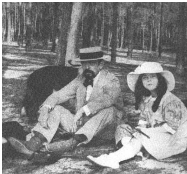
s svojo hčerko z vzdevkom Chouchou

Po Peleasu in Melisandi se je lotil pisanja scenske glasbe in baletov (takrat je nastala npr. misterijska igra Mučeništvo sv. Boštjana ).