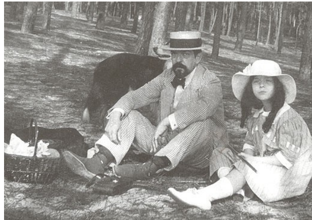
Claude debussy s svojo hčerko

Skladatelj je živel v revščini z modistko Gabrielle Dupont in se le težko preživljal. Leta 1899 se je oženil z Roaslie Texier in se od nje ločil leta 1908, ko se je poročil z Emmo Bardac-Moyse.