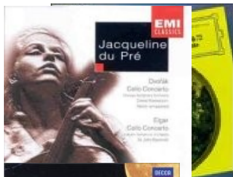
Cello Concertos Slavonic Dances