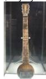
Slika 1 Prva električna kitara

Orville Gibson je predlagal, pol-akustično kitaro opremljeno z mikrofoni. Električni kitari je pot utrla tovarna Gibson, ki je leta 1935 izdelala prvo takšno glasbilo, pravzaprav španski model z dodanim odvzemnikom, imenovan električna španka. Prva komercialno uspešna kitara pa je bila Fender Esquire (kasneje »Telecaster«) leta 1950, ki jo je izdelal električar in ustvarjalec ojačevalnikov Leo Fender, nato pa leta 1954 eno najbolj kopiranih od takrat: Stratocaster. Istega leta je iz tovarne Kalamazoo prišel prvi model znamenite Gibson Les Paul. Leo Fender je prav tako nakazal v razvoju prve komercialno uspešne električne bas kitarese imenujejo Fender Precision Bass, ki je bila uvedena leta 1951. Sedaj v 21. Stoletju se Stratocaster in Les Paul oblike večkrat le kopirajo.