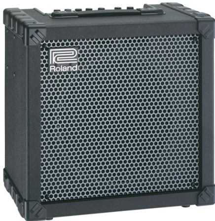
Slika 20 tranzistorski ojačevalec Roland Cube

Tranzistorske ojačevalci pa delujejo s tranzistorji ali polprevodniška dioda. Taki ojačevalci so cenejši za proizvodnjo, saj tranzistor najdemo v skoraj vsaki električni napravi. Uporablja se za ojačevanje, preklapljanje, uravnavanje napetosti, modulacijo signalov in za še veliko drugih stvari. Vseeno je zvok pri takih analognih ojačevalcih slabši kot pri »lampaših«, a še vedno zelo soliden.