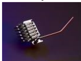
Slika 14 Floyd Rose tremolo

Nekatere električne kitare imajo tudi tremolo - vzvod nameščen na poseben most, ki lahko napne ali sprosti strune, spremeni njihov ton in ustvari vibrato efekt. Ko ročico izpustimo, vzmeti vrnjo kobilico v prvotni položaj.