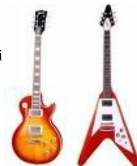
Slika 3 Gibson Les Paul in Flying V

Slavna Gibsonova kitara »Flying V« (leteči) pojavila leta 1958, ko si je tovarna obnoviti ugled in bogastvo. Futuristična uspešna, čeprav jebilanerodna za Leta 1962 je Vox predstavil Phantom kitaro, prvotno izdelano v