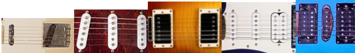
Slika 8 S-S