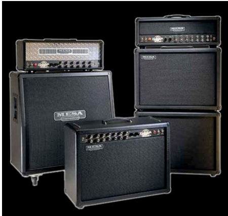
Slika 15 Mesa/Boogie ojačevalci z ločeno glavo in zvočnikom

ojačevalna glava ločena od zvočnika, povezana pa sta preko kablov. Glava je ponavadi postavljena na vrh enega izmed zvočnikov.