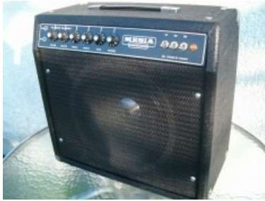
Slika 17 Japonski klon ojačevalca Mark 1

»Lampaši« so pojem za kvalitetno izvedbo zvoka. Večinoma pa so navadnim smrtnikom praktično nedosegljivi zaradi visoke cene. Zadnje čase pa so se začeli pojavljati tudi nižjecenovni modeli, večinoma kitajskega porekla. Določeni modeli pa po kvaliteti izdelave, izgleda in izvedbe zvoka skoraj ne zaostajajo za ameriškimi in angleškimi modeli.