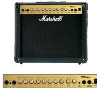
Slika 16 Kombiniran ojačevalec Marshall