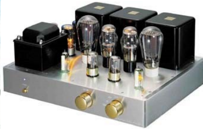
Sliki 18 in 19 elektronke