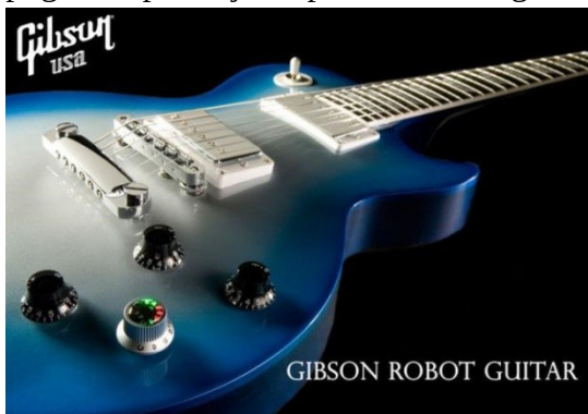
Slika 4 Gibson Robot guitar

Leta 2007 je na trg prišla nova Gibson kitara imenom Gibson Robot Guitar. Uглаšena je z zapletenim elektronskim sistemom. Ta kitara obeta naj bi revolucionirala obdobje, saj bi na koncertih sedaj uporabljali le eno kitaro za vse različne uglasitve. Od svojega rojstva v sredini dvajsetega stoletja do danes, se je njen pomen v popularni glasbi zelo povečal. Njena slika se pogosto uporablja na plakatih in drugih koncertih.