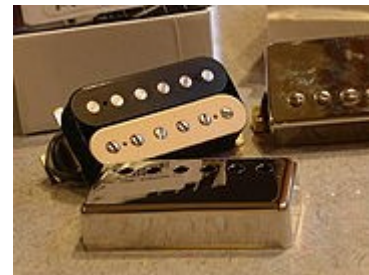
Slika 7 Dvojni "humbucker", ki ga izdeluje firma PRS

Posledica tega pojava je povečana indukcija, bolj so poudarjene nižje frekvence, višje pa so manj izrazite, kot bi bile pri navadnem, enojnem magnetu. Ta šibek signal se pošlje na ojačevalnik. Vibracije, ki jih povzročata materialno telo in vratu vožnjo še naprej vplivajo na vibracije niza, zato je les, ki se uporablja (ali, kjer je to primerno, drugih materialov) je tudi določen vpliv na zvok. Kitara ima značilen »humbuckerski ton«. Tovrstni ton je »topel in nasičen«, za razliko od tona enojnega magnetov, ki je bolj »hladen in čist«.