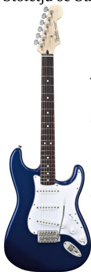
Slika 2 Fender Stratocaster