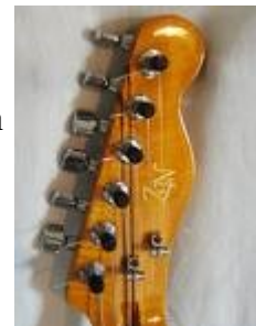
Slika 13 Glava Fender Telecaster

Kitara je lahko uglasena na različne načine, cilj določene uglasitve pa je, da se lahko prijema akorde in igra lestvice s čim manj premiki roke in prstov po vratu kitare. Najpogostejša uglasitev pa je tako imenovana EADGHE. Toni in frekvence strun so predstavljeni v tabeli, pri čemer je prva struna tista, ki zveni najvišje in šesta tista, ki zveni najnižje. Iz tabele je razvidno da so strune v intervalih kvarte, le med četrto in peto struno je zmanjšana kvarta.