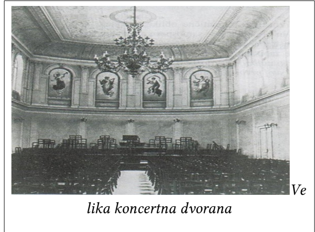
Ve lika koncertna dvorana

Ves čas so poučevali igranje na godala in pihala, vendar se tudi ni obdržala, tako si je morala ves čas pomagati z domačimi diletanti ( nekdo, ki se z nečim ukvarja iz veselja, prostovoljec ) ter s tujimi, zlasti češkimi poklicnimi glasbeniki.