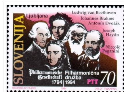
Prilož nostna znamka iz leta 1994 (častni člani)

Ludwig van Beethoven je postal njen častni član 1819, potem ko je družba izvedla njegovo šesto simfonijo. Skladatelj jim je za izvedbo poslal prepis še nenatisnjene partiture z lastnoročnimi popravki in dodatki, shranjena