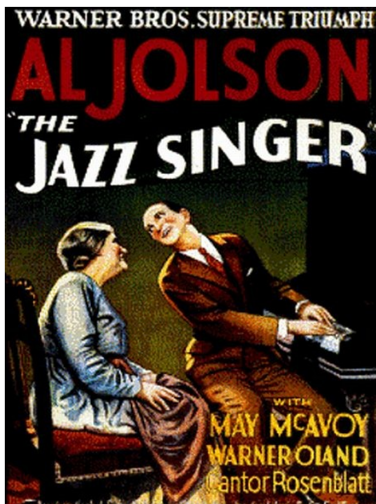
Slika 2. Pevec jazza

Prvi zvočni film je prišel v javnost leta 1923 v New Yorku. Ta film je bil še zelo kratek in trajalo je še naslednja 4 leta, da so naredili prvi dolg film z glasbo in zvokom nasploh. Leta 1927 so predstavili prvi daljši zvočni film z naslovom Pevec jazza (The jazz singer). Glavno vlogo je igral takrat zelo priljubljeni pevec Al Jonson , za katerega pa je bila to prva filmska vloga. V filmu je dobil priložnost zapeti šest svojih skladb.