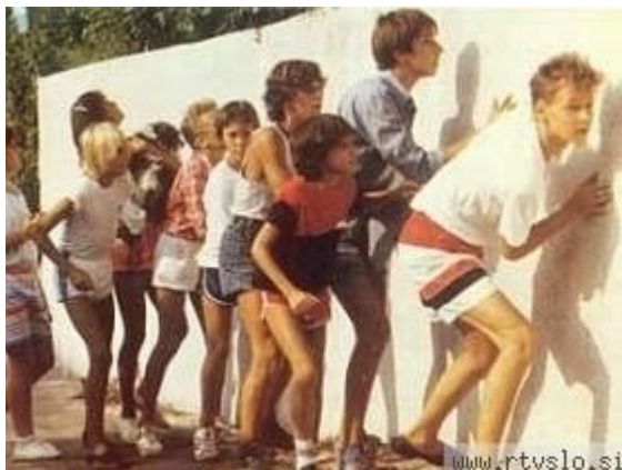
Slika 7: Poletje v školjki

Poletje v školjki je slovenski mladinski film iz leta 1985. Film je režiral Tugo Štiglic, glasbo za celoten film vključno z znano pesmijo »Prisluhni školjki« je napisal Jani Golob , izvajala pa jo je skupina Black and White s pomočjo Mihe Kralja .