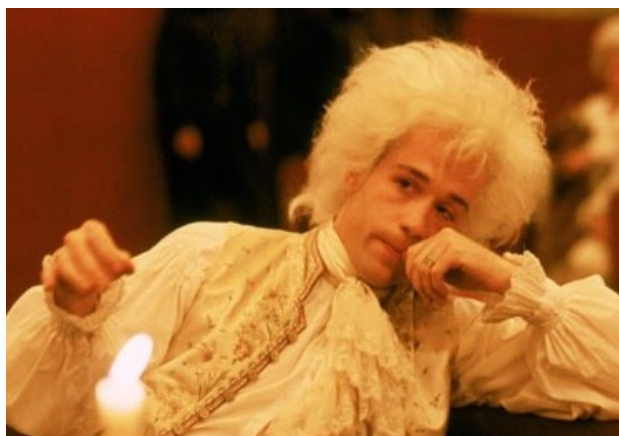
Slika 4: Scena iz filma Amadeus