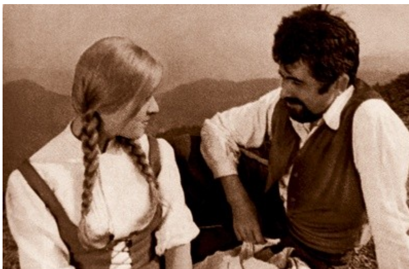
Slika 8: Cvetje v jeseni

Za zgodovino slovenske filmske umetnosti je pomemben še film Vesna , za katerega glasbo je prispeval Bojan Adamič (Jara gospoda, Trenutki odločitve, Ples v dežju, Lažnivka).