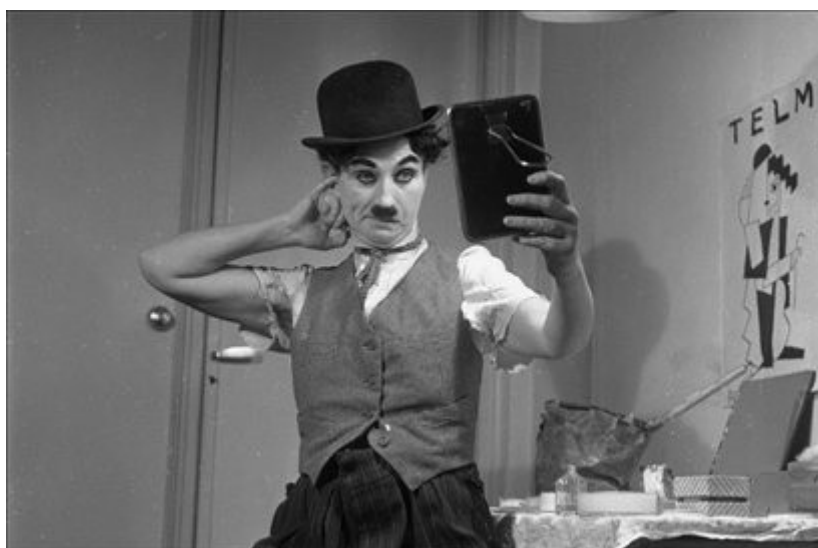
Slika 1: Charlie Chaplin

Obdobje nemih filmov in filmov s glasbeno spremljavo je trajalo 32 let in v tistem času so se začela razvijati kina in prve filmske hiše. Ker nemi filmi niso imeli dialogov ter ostalih govorov, so filmarji naslove filmov priredili tako, da je občinstvo razumelo vsebino filma. Igralci so imeli v nemih filmih največjo vlogo in so morali znati zelo dobro izražati svoja čustva in mišljenja preko obrazne mimike in govornice telesa, saj so morali gledalcem ponazoriti dogajanje v filmu. Eden bolj znanih igralcev pa je zagotovo Charlie Chaplin . Leta 1913, pri triindvajsetih letih je podpisal prvo pogodbo za film in se še isti mesec odpravil v Hollywood. Njegov prvi film je bil Making a living, ki je izšel leta 1914. V tistem letu je naredil 35 filmov in skozi naslednja leta postal zelo zaželen igralec. Prvi daljši film je bil Otrok (The Kid). Najbolj znan je po vlogi smešnega brkatega potepuha. V svojem življenju je dobil tudi oskarja. Umrl je leta 1977, v spanju.