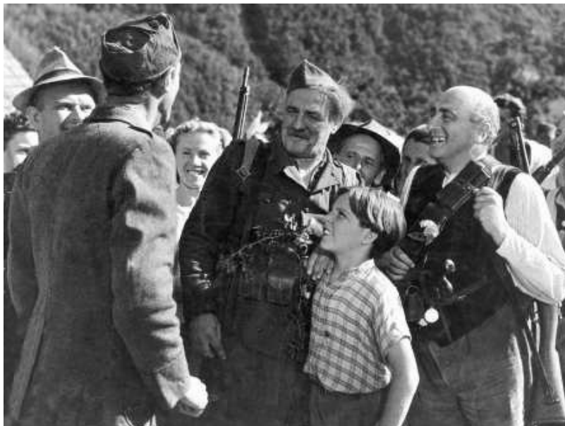
Slika 5: Prizor iz filma Na svoji zemlji

Marjan Kozina nedvomno sodi med plodovitejše slovenske glasbene ustvarjalce. Podpisal se je pod filme » Na svoji zemlji « (1949), » Dolina miru « (1956), morda najbolj znan pa je kot avtor glasbe za slovenski mladinski film » Kekec « (1951).