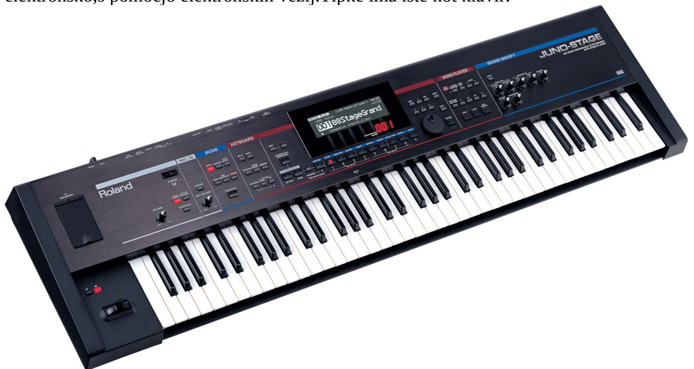
SLIKA 16: Sintetizator

Prvi sintetizator je izdelal Robert A. Moog leta 1964. Sintetizator ustvarja zvok elektronsko, s pomočjo elektronskih vezij. Tipke ima iste kot klavir.