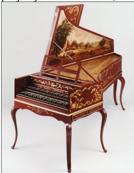
SLIKA 5: Čembalo

Gradili so tudi večje in težje instrumente. Tak instrument je bil čembalo. V obdobju med 16. in 18. stoletjem je bil najpogostejši predhodnik klavirja. Imel je obliko današnjega klavirja. Največja pomanjkljivost čembala pa je bila, da se z močjo udarca na tipko jakost tona ni spremenila. Razlika med čembalom in klavirjem pa je ta, da ima čembalo črne tipke na spodnjih tipkah, bele tipke pa ima na zgornjih tipkah, ravno nasprotno kot pri klavirju. Čembalo je bil zelo priljubljen v dobi baroka, zato še danes nanj izvajajo baročna dela.