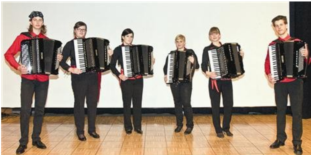
SLIKA 14: Harmonikarski orkester, tudi z kromatično harmoniko.