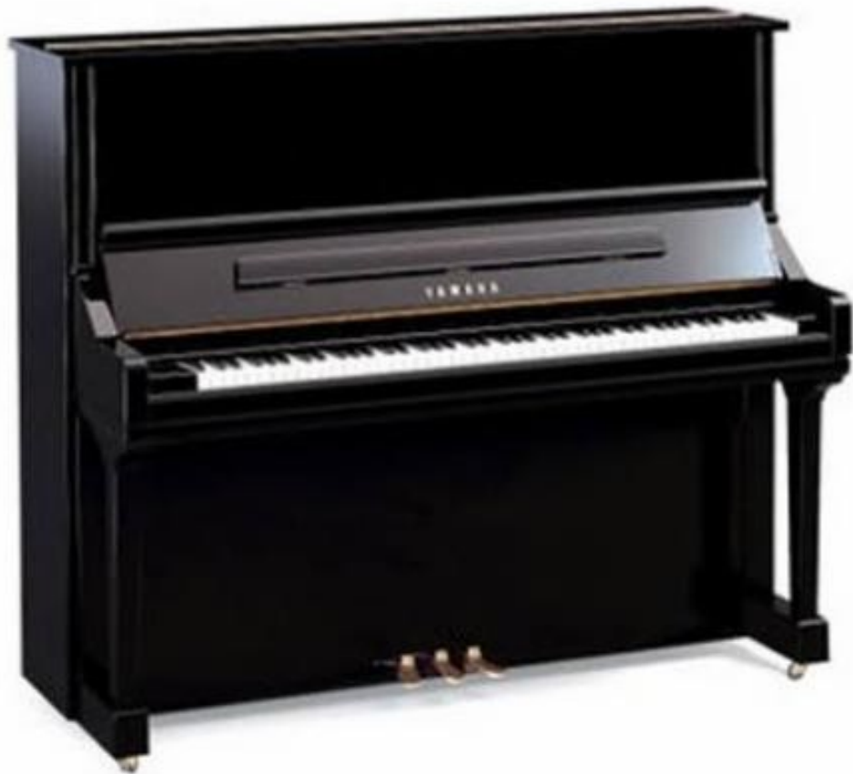
SLIKA 9: Pianino

Pianino je manjši klavir, pri katerem so strune obrnjene vertikalno. Njegova oblika je vodoravna in zavzame manj prostora kot klavir. Njegovo delovanje pa je bolj zapleteno. Vse do konca 18. stoletja je bil pianino le vodoravni klavir postavljen navpično. Nato pa so v začetku 20. stoletja na Duanju in v Philadelphii razvili manj okorni različici pianina. Takrat je bil pianino tako priljubljen, da so ga vgrajevali celo v postelje in drugo pohištvo. Pianino nima tako močnega zvoka kot klavir, a je vseeno danes eden najpomembnejših glasbil v jazz glasbi.