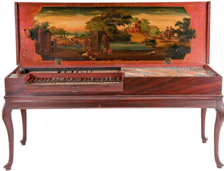
SLIKA 1: Klavikord

Klavikord je najverjetneje nastal v 12. stoletju, njegov razvoj pa je trajal kar 6 stoletij. Klavikord pa na zgradbo delimo na dve obdobji. Najprej je bil do začetka 18. stoletja vezani klavikord, to pomeni da je bilo več tangent (kovinska ploščica) za eno struno. Nato pa je do začetka 19. stoletja nastal nevezani klavikord, ki je imel toliko tipk kot strun.