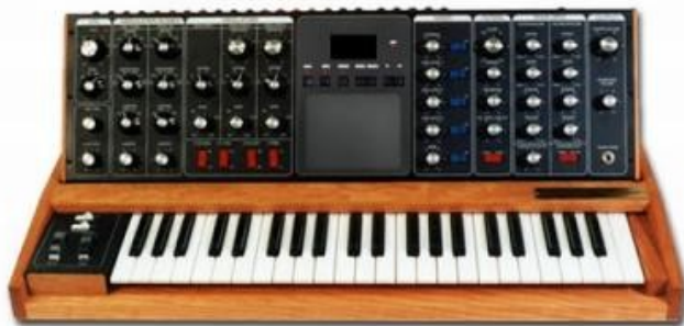
SLIKA 17: Sintetizator Moog