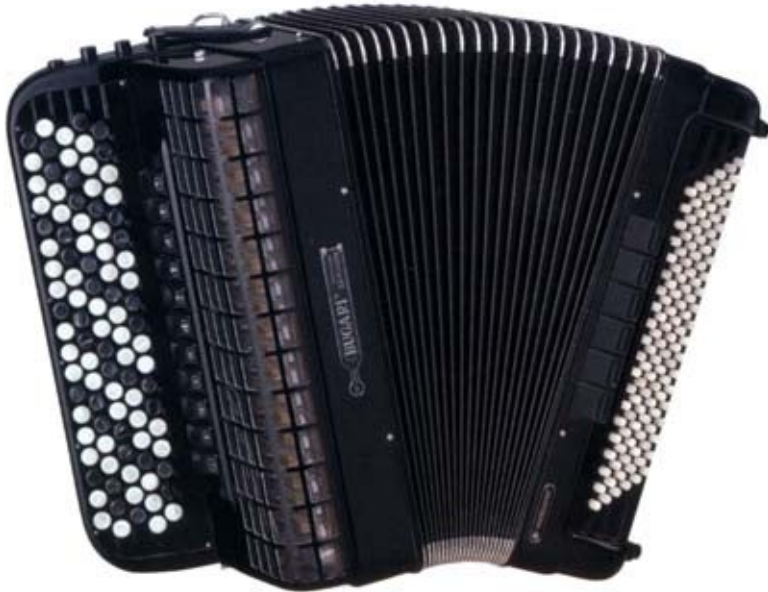
SLIKA 13: Kromatična harmonika

Kromatična harmonika je tip harmonike, ki združuje diatonično in klavirsko harmoniko v eno. Na desni strani ima gumbe (tako kot pri diatonični harmoniki) na levi strani pa ima popolnoma enake base kot so pri klavirski harmoniki.