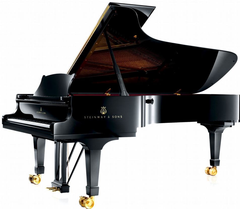
SLIKA 8:Koncertni klavir

Klavir je sestavljen iz okvirja z napetimi strunami, resonančnega dna, klaviature z mehanizmom ter sistemom pedal. Trup na treh nogah, ki mu daje značilno obliko, služi le za namestitev vseh sestavnih delov in pri nastanku zvoka pa nima posebne vloge.