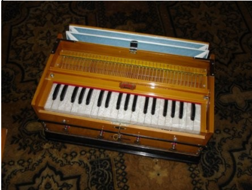
SLIKA 6: Harmonij

Harmonij so izumili v starem veku. Zelo priljubljen je bil v Indiji, kamor so ga prinesli misionarji. Danes ga imajo v Indiji za svoje nacionalno glasbilo. Je predhodnik klavirske harmonike.