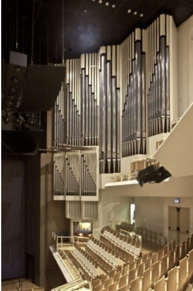
SLIKA 15: Orgle v Gallusovi dvorani Cankarjevega doma.

Orgle so največji in najbolj zapleten inštrument. Prve orgle je leta 246 pr.n.št. sestavil izdelovalec igrač Ktesibos iz Aleksandrije. V svojem razvoju so doživele nešteto izboljšav, a je princip ostal enak: vrsta piščali, povezana z rezervoarjem stisnjenega zraka. To da so orgle cerkven inštrument ne drži povsem, saj so jih Rimljani uporabljali pri gladiatorskih bojih, nato pa so jih uporabljali na srednjeveških dvorih, bile so znak bogastva. Danes pa orgle uporabljajo predvsem v cervah. Največje orgle v Sloveniji so v Gallusovi dvorani Cankarjevega doma.