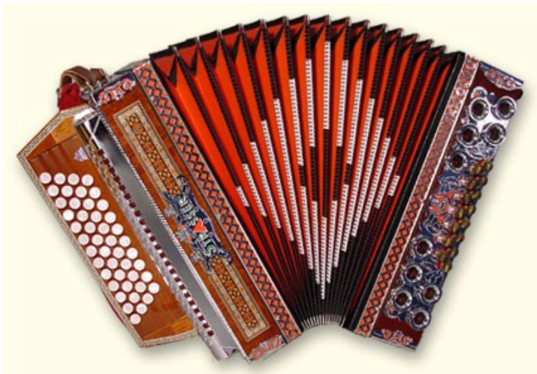
SLIKA 11: Diatonična harmonika

Diatonična harmonika (tudi frajtonerica, gumbna ali prostotonska harmonika) je v osnovi ljudsko glasbilo. Namesto črno-belih tipk ima gumbe pri basih pa ima malo drugačne gumbe kot pri klavirski harmoniki in tudi manj jih je. Ton se pridobiva isto kot pri klavirski harmoniki (z vlečenjem meha). Pri starejših diatoničnih harmonikah zanihata dva jezička za vsak ton, pri novejših pa celo trije. Starejše diatonične harmonike so enovrstne ali dvovrstne, novejše pa premorejo tudi štiri vrste gumbov na melodični strani. Diatonična harmonika je zelo pomembna v narodno zabavni glasbi. Še posebej v ansamblih (kot so Ansambel Lojzeta Slaka, Ansambel Franca Miheliča in drugi).