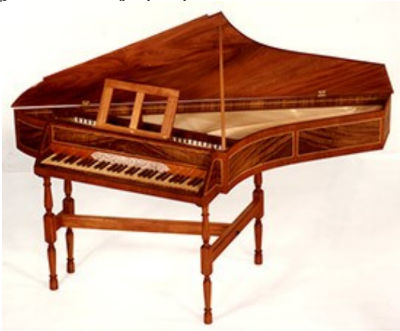
SLIKA 4: Špinet

Špinet je pomanjšana oblika čembala. Grajen je bil v obliki majhne omare, da so ga lahko lažje pospravili.