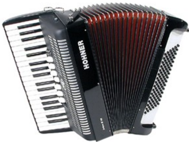
SLIKA 10:80-basna klavirska harmonika

Klavirska harmonika je nastala konec 19. stoletja. Sestavljajo jo črno-bele tipke (tako kot pri klavirju) na levi strani pa so basi. Imamo več velikosti klavirskih harmonik vse od 40 pa do 120 basne harmonike. Ta vrsta harmonike je primerna tako za solistično glasbilo kot tudi komorne skupine, orkestre. Klavirska harmonika je eden najbolj pomembnih inštrumentov alpskega stila narodno zabavne glasbe. Iz te harmonike pa se je razvila tudi bas harmonika, s katero lahko igramo nižje tone in nima basov.