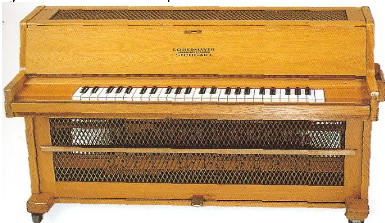
SLIKA 7: Čelesta