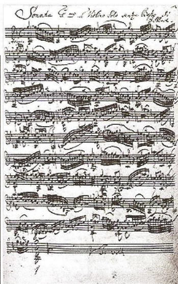
Bachov rokopis violinske sonate št. 1.

Johann Sebastian Bach je bil velik nemški baročni skladatelj in se je rodil v Eisenachu 21. marca leta 1685. Spada med največje skladatelje vseh časov in dobre organiste. Svoje glasbeno znanje je pridobil od očeta in starejšega brata. Napisal je preko 1000 del.