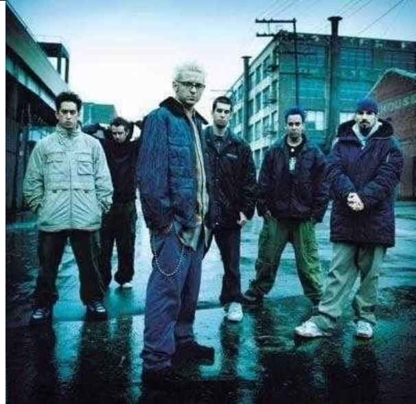
Slika 1: Linkin park na začetku kariere.