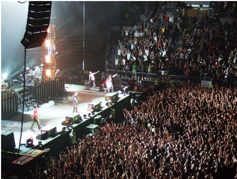
Slika 1: Linkin parkov koncert.

Na zadnji plošči so spremenili svojo zvrst in se uvrstili kot rock skupina. Na tej plošči se pojavlja več balad. Pesmi niso več tako udarne in čustvene. Govorijo o problemih, s katerimi se srečujemo v vsakdanjiku.