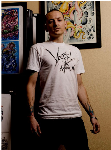
Slika 1: Chester Bennington.