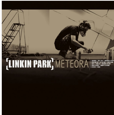
Slika 1: Ovitek plošče Meteora.

življenja. V videospotu nastopa punca, ki je nima prijateljev, starši je ne razumejo... Zadovoljstvo najde v slikanju. Videospot se konča z delom, ko ona zbeži v cerkev, tam pa skupina poje. Všeč mi je tudi pesem Somewhere I belong.