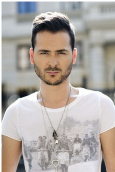
Slika 1: Edward Maya

Eduard Marian Ilie se je rodil 29. junija 1986 v Bukarešti. Bolje ga poznamo pod vzdevkom Edward Maya. Maya je Romunski pevec, producent, izvajalec in skladatelj. Diplomiral je na George Enescu srednji glasbeni šoli v Bukarešti. Trenutno študira še zadnje leto.