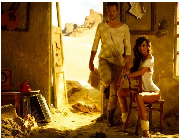
Slika 3: Edward Maya in Vika Jigulina

Maya načrtuje izid druge pesmi v letu 2011 z naslovom Mono In Love.