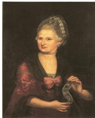
Anna Maria Mozart

Leta 1760, s štirimi leti, se je Mozart učil brati, pisati, računati in igrati na klavir pri svojem očetu. S petimi leti je koncertiral in ustvarjal prve skladbe. In sicer njegova prva skladba je bila Allegra. Ko je bil osem let star so mu v Londonu natisnili prvo simfonijo. Z dvanajstimi leti pa je še napisal njegovo prvo opero Bastien in Bastiena . Leta 1762 je oče predstavil knezu