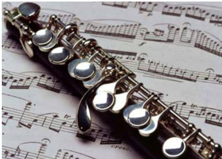
Slika 5: Pikolo