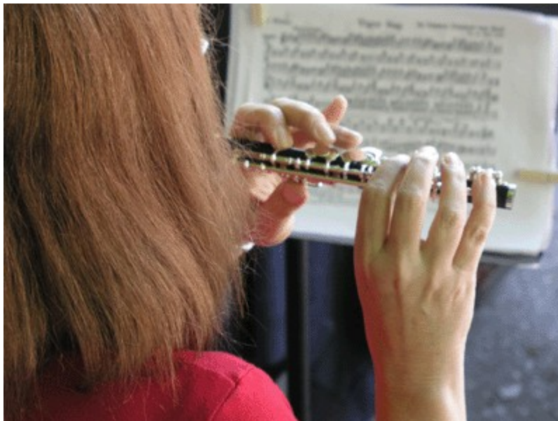
Slika 3: Pikolo

Pikolo se je prvič pojavil v orkestru okoli 1700. Do sredine 18. stoletja je bil Pikolo že dobro uveljavljen v orkestru, vendar je igral predvsem v delih vojaške narave in v ritmičnih plesih. Beethoven je bil prvi skladatelj, ki je uporabljal Pikolo v svojih simfoničnih delih. V začetku 19. stoletja je bil pikolo preprost inštrument s samo eno zaklopko. Michael Janusch je leta 1924 razvil pikolo s šestimi zaklopkami. Ta instrument je bil enakovreden s flavto v tistem času. V 20. stoletju je pikolo postal sestavni del orkestra. Skladatelji, kot so Ravel, Stravinsky, Šostakovič in drugi so zapisali pomembna dela za Pikolo.