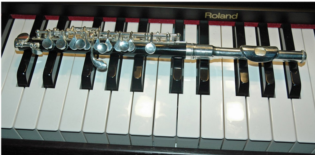
Slika 2: Pikolo na klavirju

Mala flavta ali pikolo je inštrument, velik 31 cm, torej natanko polovico flavte. Pikolo ima enako število zaklopk kot standardna prečna flavta. Zato lahko nanjo igra tudi flavtist. Ustvarja zelo piskajoč in svetel zvok. Uvrščamo ga med visokotonska pihala. Pikolo je eden najmanjših inštrumentov v orkestru, ne pa tudi najtišji. Igranje na pikolo je podobno kot pri flavti, le da zveni oktavo višje zaradi enkrat krajše in tanjše cevi, in s tem doseže zelo prodoren zvok. V kontekstu orkestra je pikolo, ki sicer sodi v družino flavt, nujno potreben za določene efekte: ptiče, pasaže, recimo pri Četrta simfoniji Čajkovskega. Nepogrešljiv je v operah, baletih. Dolgo ni veljal za solistični inštrument, danes je drugače, so pa solisti pikolisti zelo redki. Je nepogrešljivo glasbilo vsake pihalne godbe. Pikolo je bil prvotno narejen iz lesa in je bil izrazit v številnih delih uglednih skladateljev. Eno od prvih del za uporabo Pikola je bila Beethovnova Simfonija št. 5 v c-molu. Danes so pikoli narejeni iz različnih materialov, vključno s plastiko, medenino, nikljem, srebrom in vrsto trdega lesa.