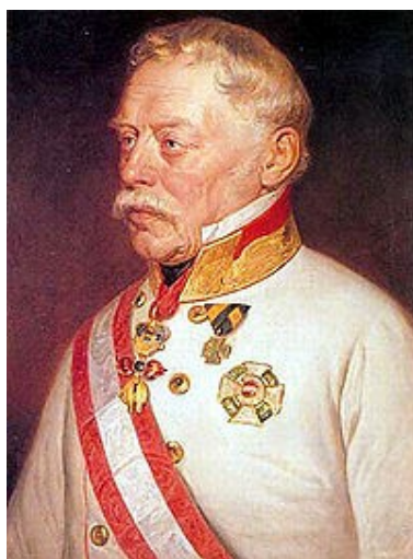
Slika 3: Josef Radetzky

Delo je posvečeno avstrijskemu feldmaršalu češkega rodu grofu Johannu Josefu Wenzlu Radetzky von Radetz, ki je bil rojen leta 1766. Rodil se je v češki plemiški družini, vendar je že kot otrok ostal brez staršev. Na Dunaju je obiskoval Terezijansko akademijo. Leta 1785 je vstopil v avstrijsko vojsko kot kadet in nato napredoval vse do feldmaršala. Koračnica predstavlja pohod vojakov. Ima vojaški značaj, vendar je glasba bolj praznična, kot vojaška.