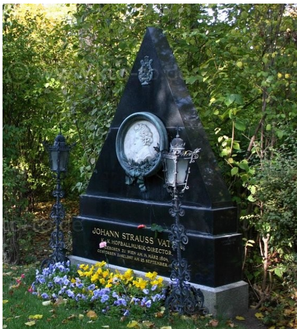
Slika 2: Johannov grob