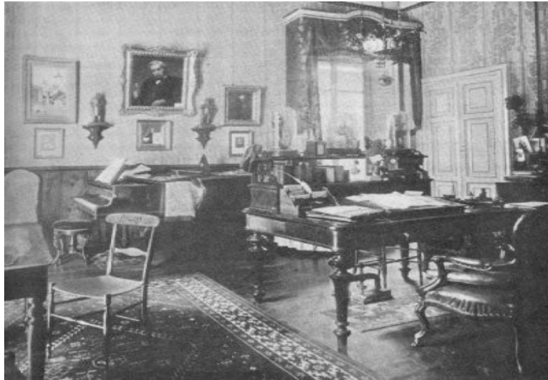
Verdijeva delovna soba