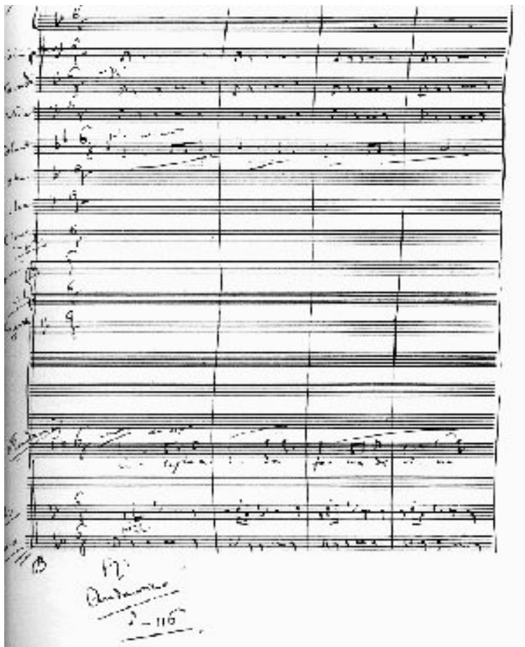
Rokopis Giuseppe Verdija