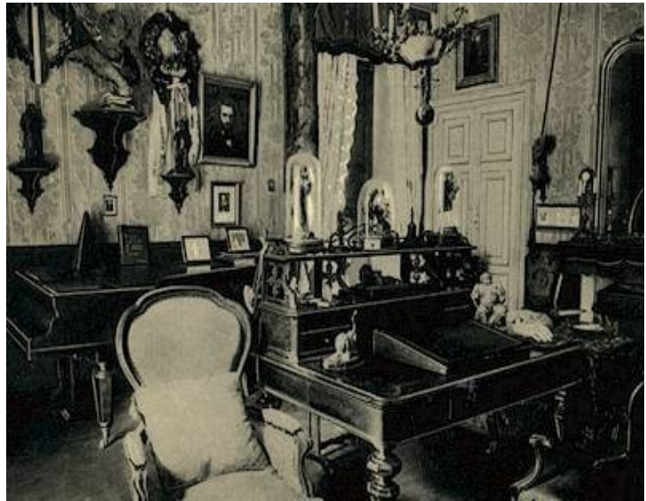
Verdijeva delovna soba