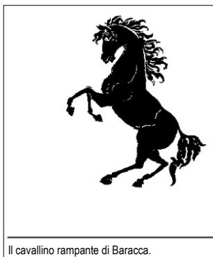
Il cavallino rampante di Baracca.

Tutti gli appassionati di corse avranno sicuramente molta familiarità con il logo Ferrari, il cosiddetto “cavallino rampante”: si tratta di un cavallino nero su sfondo giallo, di solito raffigurato assieme alle lettere SF, che stanno per Scuderia Ferrari. Il cavallo era in origine il simbolo del conte Francesco Baracca, il mitico “Asso” dell’Aeronautica Militare Italiana durante la Prima Guerra Mondiale, che lo ha dipinto sulle fiancate dei suoi aerei.