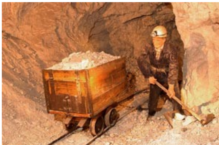
Slika 1: Rudarska dejavnost