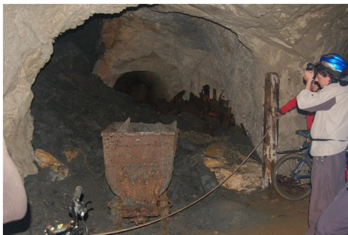
svinčeve rude v (muzejski nameni)