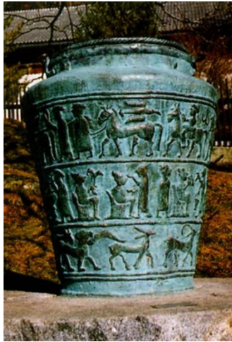
Slika 6: bronasta posoda

Svinec je v uporabi že zelo dolgo. Svinec in \beta -kositer tvorita z drugimi kovinami in med sabo zlitine. Zaradi odkritij teh zlitin je človek začel izdelovati raznovrstna orožja, ščite in okraske. Začela se bronasta (bron-zlitina svinca in kositra) doba. V času Rimljanov so svinec uporabljali za različne namene (npr. čaše za vino), pridobivali pa so ga tudi v Mežici.