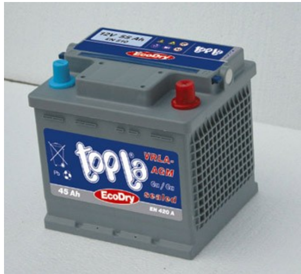
Slika 4: električni

Svinec je proforen, odporen proti kisiku, vlagi in kemikalije, zato ga uporabljajo za elektrode v akumulatorjih, kabelske obloge, izdelovanje zaslonov za zaščito pred sevanjem in obtežitev najlonske vrvice pri ribolovu. Včasih so ga uporabljali za izdelovanje vodovodnih cevi, kar pa so opustili zaradi strupenosti svinca. Svinec se namreč kopiči v organizmu.