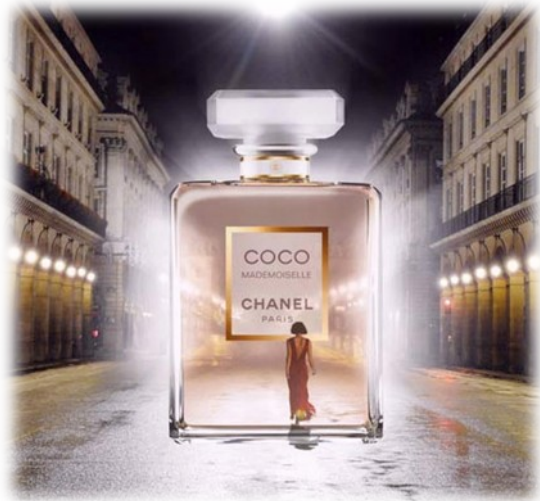
Slika 2 Parfum Coco Chanel