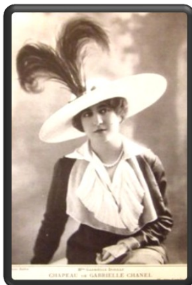
Slika 1 Klobuk Chanel, 1912. Objavljen v reviji Les Modes.