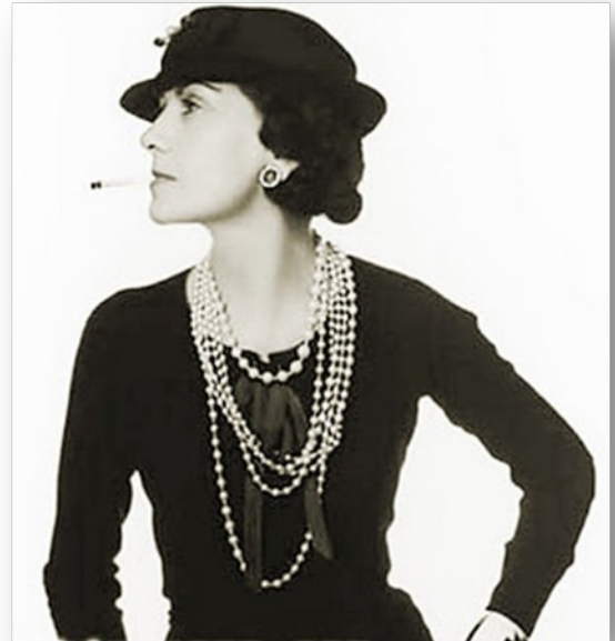
Slika 3 Coco Chanel