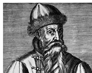
Johannes von Gutenberg (1400–1468)

Bis zum preiswerten Taschenbuch und öffentlichen Bibliotheken war es immer noch ein weiter Weg. Doch die Idee, dass Wissen allen gehören soll, ist seit Gutenbergs Zeit nicht mehr unterzukriegen.