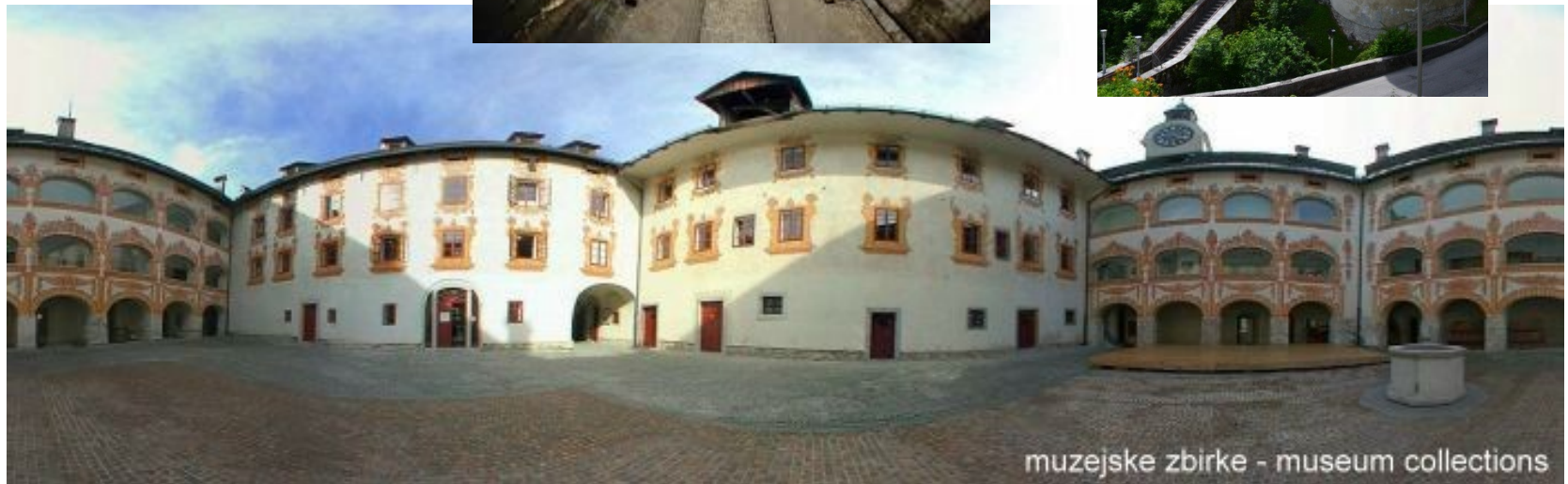
muzejske zbirke - museum collections