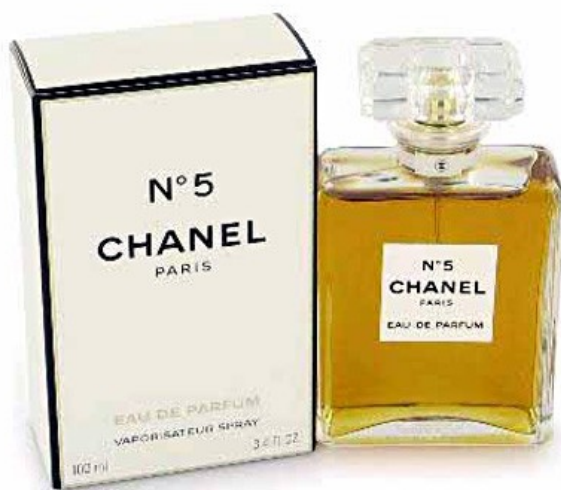
Slika 4 Chanel No. 5 parfum

Z vzorci parfuma se je vrnila v Pariz in jih delila svojim strankam. Pripovedovala jim je, da je stekleničko odkrila naključno v Grassu, jih spraševala, ali naj parfum prodaja in jih prepričala da so one zaslužne za kasnejši uspeh parfuma. Zato je »na zahtevo strank« leta 1924 ustvarila svoj parfum, Chanel No. 5. Pravijo, da je k imenu prispevalo tudi vraževerje slavne Coco. Verjela je, da je pet njena srečna številka, in ker je izmed vzorčnih dišav, ki ji jih je v izbiro ponudil Beaux, izbrala ravno dišavo pod zaporedno številko pet, je tudi za promocijo parfuma izbrala peti dan petega meseca davnega leta 1923. Očitno je bila številka res srečna, saj po 87 letih cvetno aldehydni Chanel No.5 še vedno slovi kot najbolj znan in najbolj prodajani parfum vseh časov.