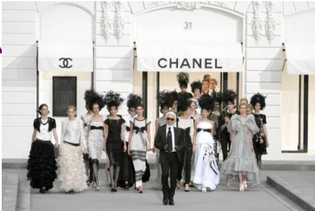
Slika 7 Karel Lagerfeld na modni reviji