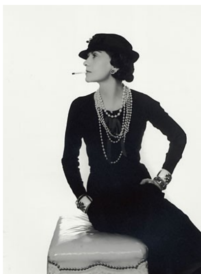
Slika 5 Coco v mali črni obleki

Večno slavo je mali črni oblekici prinesla Audrey Hepburn v filmu Zajtrk pri Tiffanyju . Za hollywoodsko igralko je takrat obleko ustvaril Hubert de Givenchy.