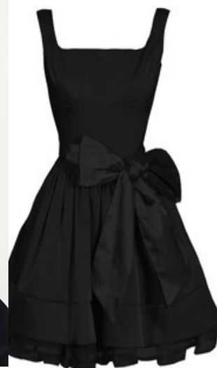
Slika 6 Mala črna oblekica

↓ Coco nikoli ni nosila oblačil drugih oblikovalcev, vedno se je zatekla k svojim kreacijam