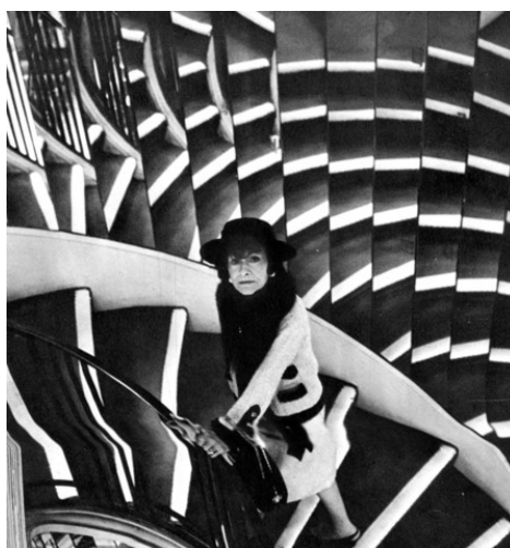
Slika 3 Coco na zrcalnem stopnišču

Coco Chanel ni obupala: »Enkrat sem že osvobodila ženske, zdaj jih bom spet, le da tega še ne vedo.« Po njenem so bili krivi novinarji, »ki niso razumeli«. Izkazalo se je, da je imela spet prav. Tri tedne kasneje je ameriška revija Life zapela hvalnico novi kolekciji, na marčevski naslovnici Vogua 3 je bil njen model – po petih letih Diorjevih ozkih pasov je pravzaprav spet ponudila »svobodo«. In ne samo to. Biti v Chanelu je ženskam pomenilo varnost in nezmotljivo eleganco. Coco se je vrnila.