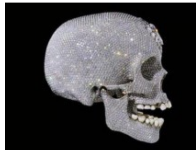
Slika 4: Danes velja frenologija za znanstveno zablodo – nauk, ki so ga kasneje ovrgli

Znanstveniki so v 19. stoletju verjeli, da je iz oblike lobanje mogoče sklepati na človekove duše, lastnosti in možnosti (frenologija) in da je mogoče iz potez obraza proučevati človekovo osebnost (fiziognomika). Kasneje so ta dva nauka ovrgli.