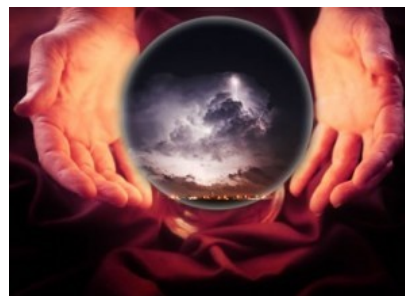
Slika 2: Je res možno gledati v prihodnost?

Glede na to, da parapsihološke pojave ne moremo raziskati se mnogi ljudje sprašujejo: Ali pri ljudeh torej res obstaja sposobnost izvenčutnega zaznavanja? Ali duhovi res prebivajo v živalih, rastlinah, ljudeh...? Ali so bili nekateri ljudje res čudežno ozdravljeni? Je vse to mit ali resnica? Poglejmo malo v preteklost.