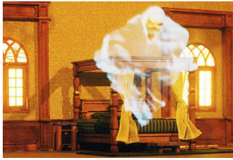
Slika 3: Ali duhovi zares prebivajo v živih bitjih?

Nekatere politeistične religije (npr. egipčanska, grška) so verjele, da je duša neka magična sila, ki prebiva v živih bitjih in jih oživlja. Verjeli so tudi, da duša med spanjem zapusti telo in se potem zopet vrne. Nekateri so bili prepričani, da se duša po smrti vrne v telo. Zato so nekatera ljudstva trupla ob smrti mumificirali.