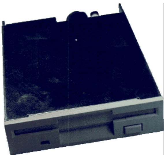
Slika – 3: Disketnik za diskete premera 90 mm

Danes je najbolj razširjena disketa s premerom 3,5 (90mm), uporaba diskete premera 5,25 je vedno manjša. Pomnjenje podatkov je na isti način kot pri disku. Podatki na disketi so kodirani isto kot na disku in podatki so povezani v mape. Na disketo premera 3,5 lahko zapišemo 1,44 MB podatkov. Disketa 3,5 ima v zgornjem delu dve kvadratni odprtini. Leva označuje zmogljivost diskete, če je odprtina je zmogljivost večja, če odprtine ni je zmogljivost diskete manjša. Desna odprtina se uporablja za zaščito. Če odprtino zapira drsnik lahko podatke beremo in jih zapisujemo, če pa je odprta lahko podatke le beremo. S tem so podatki zaščiteni proti brisanju. Disketo uničita toplota ali bližina magneta.