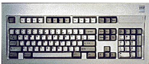
Slika – 1: Tipkovnica