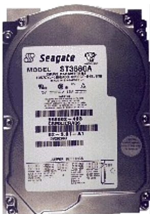
Slika – 2: Trdi disk