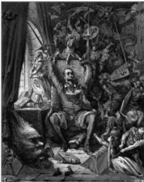
Doréjeva ilustracija Don Kihota

Don Kihot je izmišljeni literarni junak. Kihot pomeni lesen oklep za noge, kihada čeljust, kesada pa goban. S temi vzdevki je Cervantes označil svojega suhega junaka. Don Kihot se je zavzemal za pravico, bil je privrženec zveste ljubezni, zagovornik platonične ljubezni, zagledan je bil v preteklost, v viteške ideale, bil je optimističen in sprva celo humoren, proti koncu pa je postajal vedno bolj pasiven in vedno manj komičen. Njegove avanture so postale celo mučne, tako da je proti koncu romana njegov lik vse bolj tragičen. Don Kihot (Vitez žalostne podobe) je tragikomičen lik, tragikomičnost pomeni, da se žalost sprevrča v smeh in obratno.