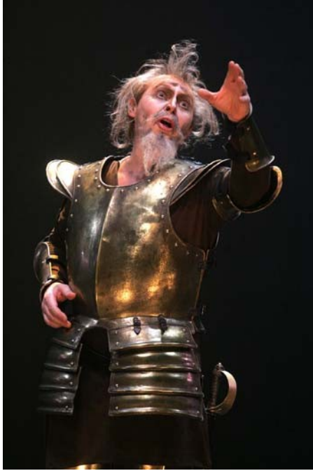
Don Kihot iz opere v Cankarjevem domu