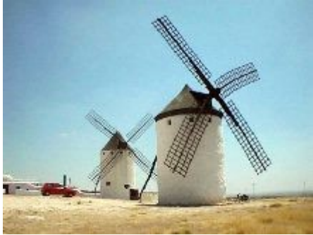
Mlini na veter.

Na koncu romana pa je Don Kihot po izgubljenem boju spoznal svoje čudne zablode in se spametoval, vendar je bilo to zanj žal prepozno, saj je hudo zbolel in oropan svojih iluzij umrl.