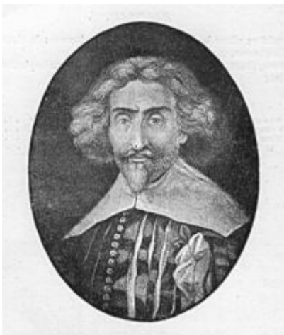
Eden izmed možnih Cervantesovih portretov