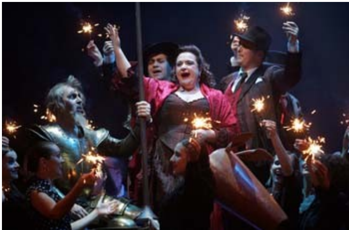
Dulsineja iz opere