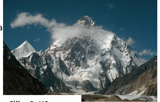
Slika 3: K2

Dogajalni čas v knjigi ni natančno določen, vendar se da razbrati, da je zgodba postavljena v sodobnost. Prične se z vzponom na Eiger v Švici nato pa čez 14 let z vzponom na himalajski vrh K2.