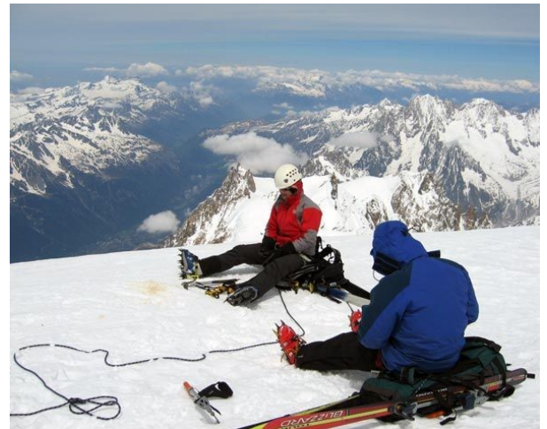
Slika 4: Alpinista na gori

Bolje bi bilo, če bi Angleži vsaj malo zaupali tujcema in tako bi lahko ostal ponesrečeni plezalec še živ. Kot plezalci pa bi lahko navezali prijateljske vezi med sabo. Menim, da ni pravično meriti človeka po njegovih zunanjih znakih (barvi kože, narodnost...), pač pa po njegovih dejanjih.