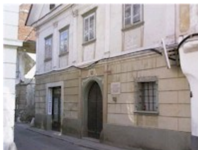
Linhartova rojstna hiša

Slovenski dramatik, pesnik, zgodovinar in šolnik Anton Tomaž Linhart se je kot sin premožnega meščana rodil 11. 12. 1756 v Radovljici, mestu, ki je bilo takrat še stisnjeno med srednjeveško obzidje.